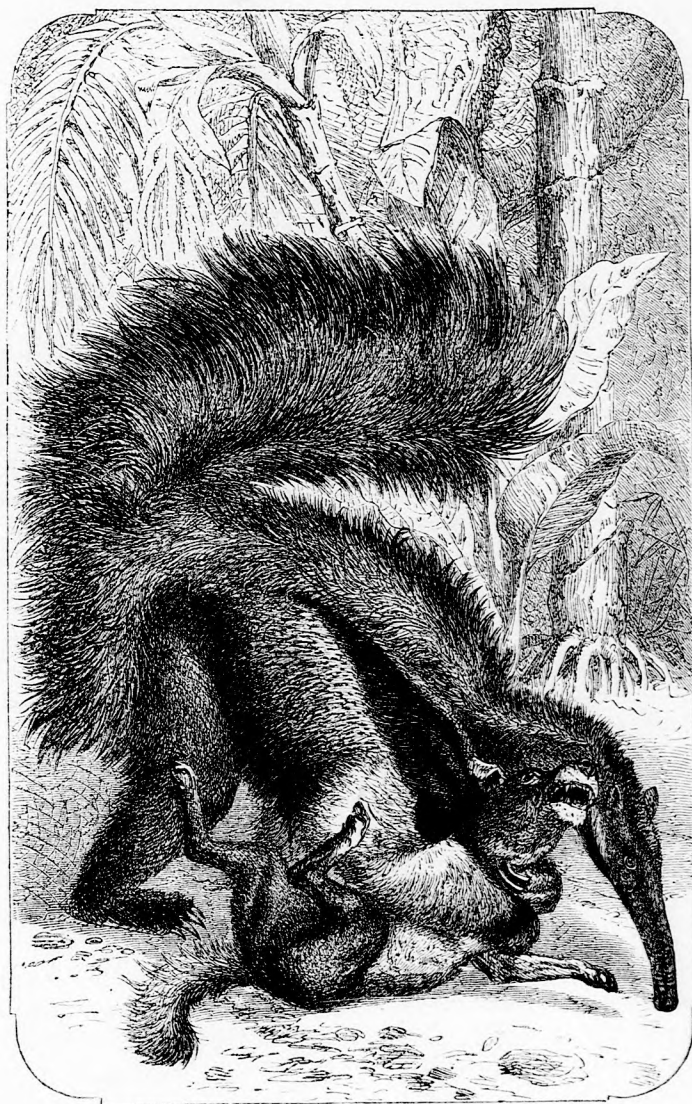
A JURUMI. (Lásd a 124. lapon.)