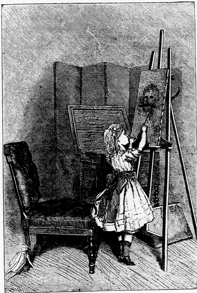
KONTÁRKODÁS. (Lásd a 118. lapon.)

halálra vált ijedtében; bizonyosra vette, hogy ez a szigorú, rideg ember megtudta, hogy ő itt van és most érte jött. A szekrestyés az oltár mellé ment, oda, hol az a per-