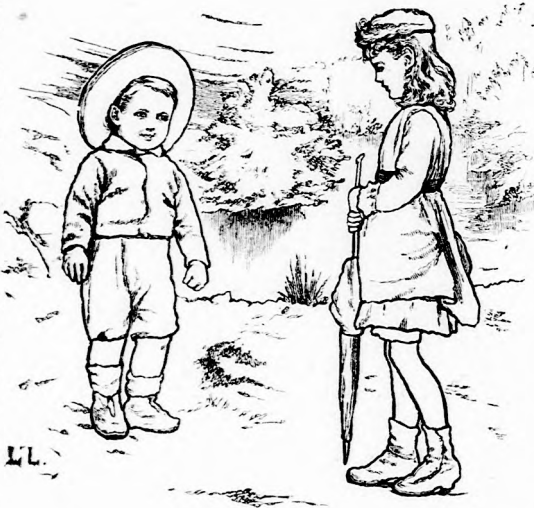
— MEGYEK EL, MESSZIRE. (Lásd a 185. lapon.)

Keresték, kutatták, de nem láttak senkit s egy kis forrásnál pihentek meg, mely ott fakadt a hegy oldalában. A forrás vize halkán mormogva folydogált le a völgybe s amit mormogott, azt a tündérkékek meg is érthették, mert így szölt: