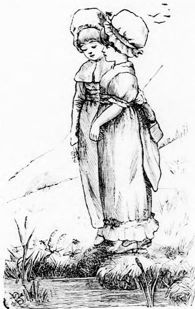
... ÁLLDOGÁLTAK A VÍZ MELLETT.

A kis tündérek egészen fölháborodtak a kis lányok sorsán. Ez már csakugyan borzasztó, ilyen gyönyörű időben iskolába menni, mikor olyan kellemesen lehetne