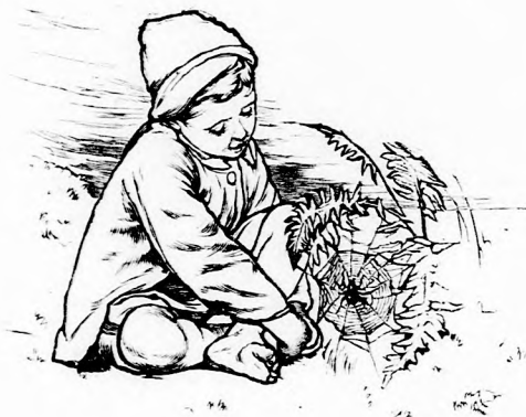
...NÉZEGETETT EGY PÓKOCSKÁT.

— Lehet is, nem is, felelé a tündérr királynő mosolyogva. Vannak a földön emberek, a kik igazán szerencsétlenek és a kiknek a sorsán sokszor nem lehet segíteni. Nincs más hátra, minthogy megadásal tűrjék sorsukat. De talán még többen vannak olyanok, kik panaszkodnak, elégedetlenkednek, pedig nincs rá igazi okuk, hanem csak botor szeszélyből, meggon-dolatlanságból kívánkoznak egyébre; pe-