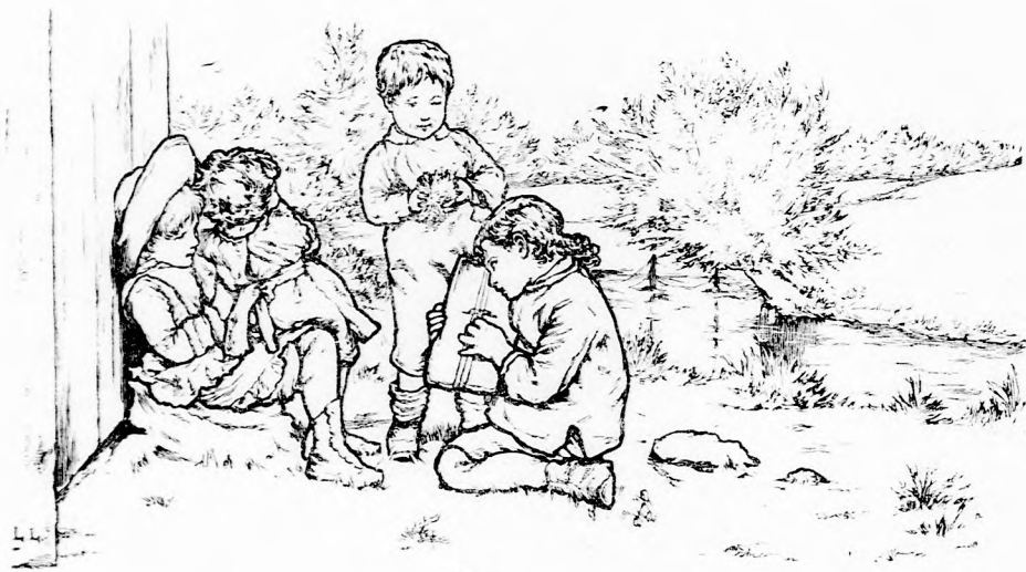
...SZOMORU NÓTÁT JÁTSZOTT.

patak hűségesen vezette őket. Mentek, mendegéltek s végre ismét egy házacska közelébe értek. A ház küszöbén egy kis leány ült, ölében piczike gyermekkel, mellette pedig nagyobbacska fiu állt, kezében egy madárfészekkel. De most nem ügyelt a madárfészekre, hanem mind a hárman sajnálkozva néztek egy negyedik gyermekre, ki ott guggolt előttük. Szegényes öltözetű fiucska volt, nagyon sápadt,