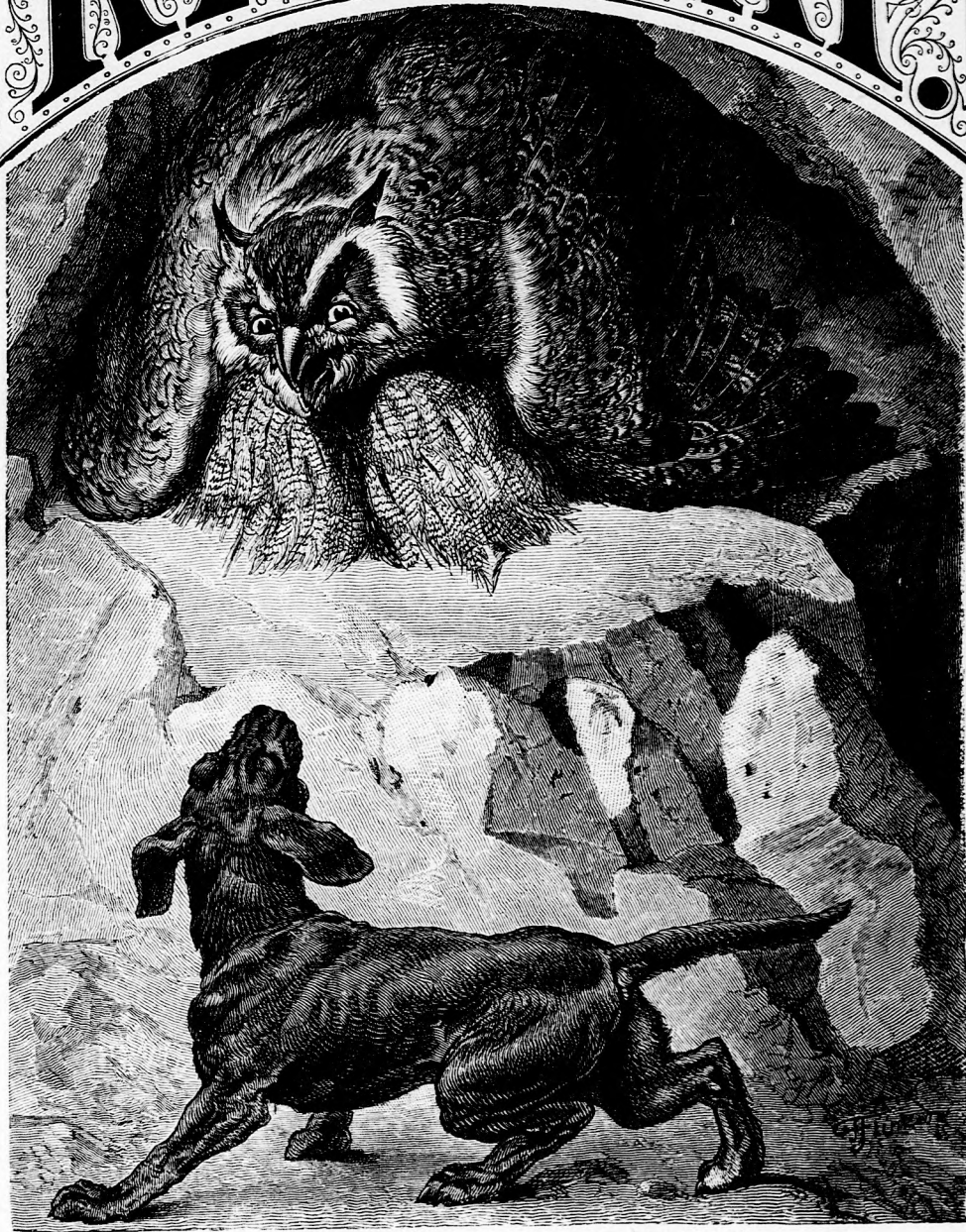
...BAGOLY FENYEGETETT. (Lásd a 182. lapon.)