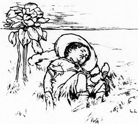
...SZUNDIKÁLT A FÜBEN.

— Nincs semmim... igaz, már megettem a süteményt, elfogyott az utralaló