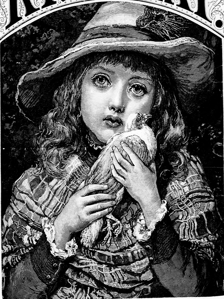
ESZTIKE S AZ Ő GALAMBJA.. (Lásd a 221. lapon.)