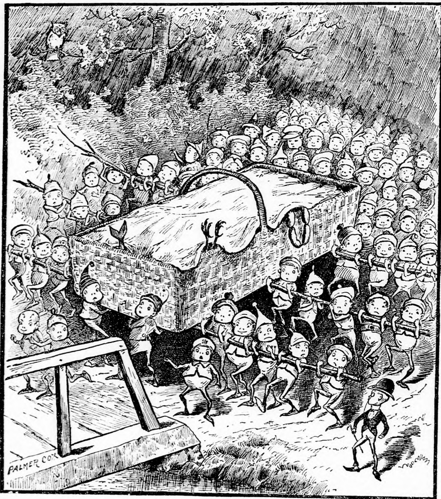
... A KOSÁR... MINDENFÉLE JÓVAL LEHETETT TELE. (Lásd a 223. lapon.)

— A király tilalmával daczolvá be-törtél ide, te, a számüzött, hogy ok-talan beszéddel bolondítsd a királyleányt? Meg-ölhetnélek, de nem teszem, mert tudom,