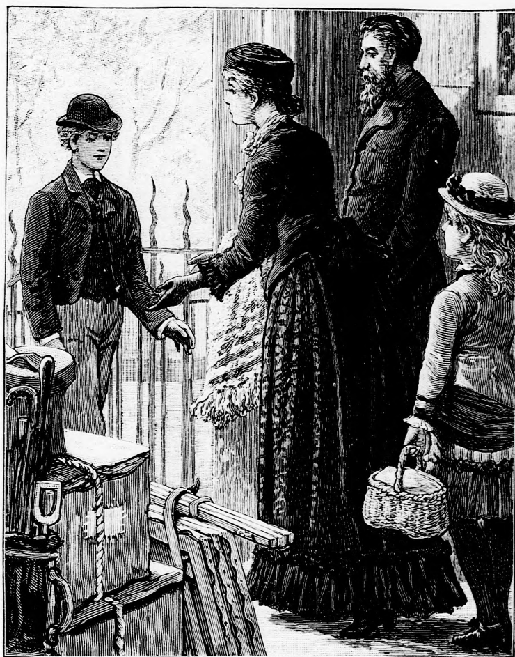
HUSVÉTI SZÜNIDŐN. (Lásd a 215. lapon.)

Mindenki végezze a maga dolgát, ha nehezen megy is, és csak amit már épen- séggel nem ért, azt magyaráztassa meg a