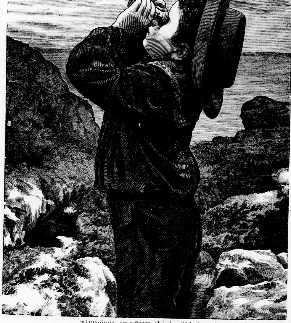
...TÁVCSÖVÖN ÁT NÉZET. (Lásd a 251. lapon.)