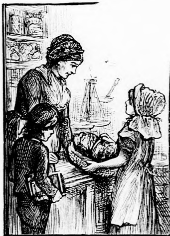
...ÁTADTÁK A KOSARAT. (Lásd a 247. lapon.)