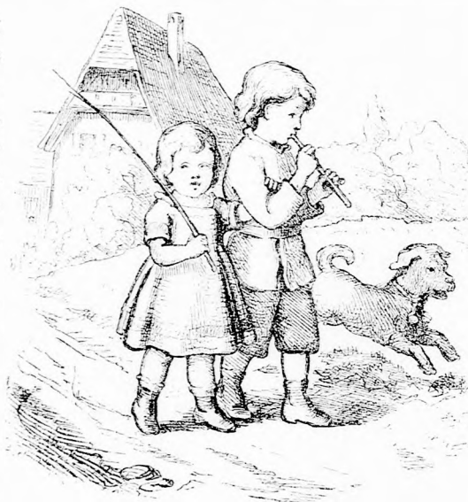
VIDÁM UTAZÁS. (Lásd a 55. lapon.)

— Dehogyan verlek! De nem is eresztelek, mert hova lennél ilyen sánta lábbal? Előbb meg kell gyógyulnod, aztán mehetsz odább. Majd én gondoskodom rólad.