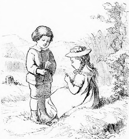
... BE AZ ERDŐBE. (Lásd a 78. lapon.)

nem háborgatja, a szarka pedig hiába való panaszáért arra íteltetik, hogy ezentul mindenki haszontalan fecsegőnek tekintse.