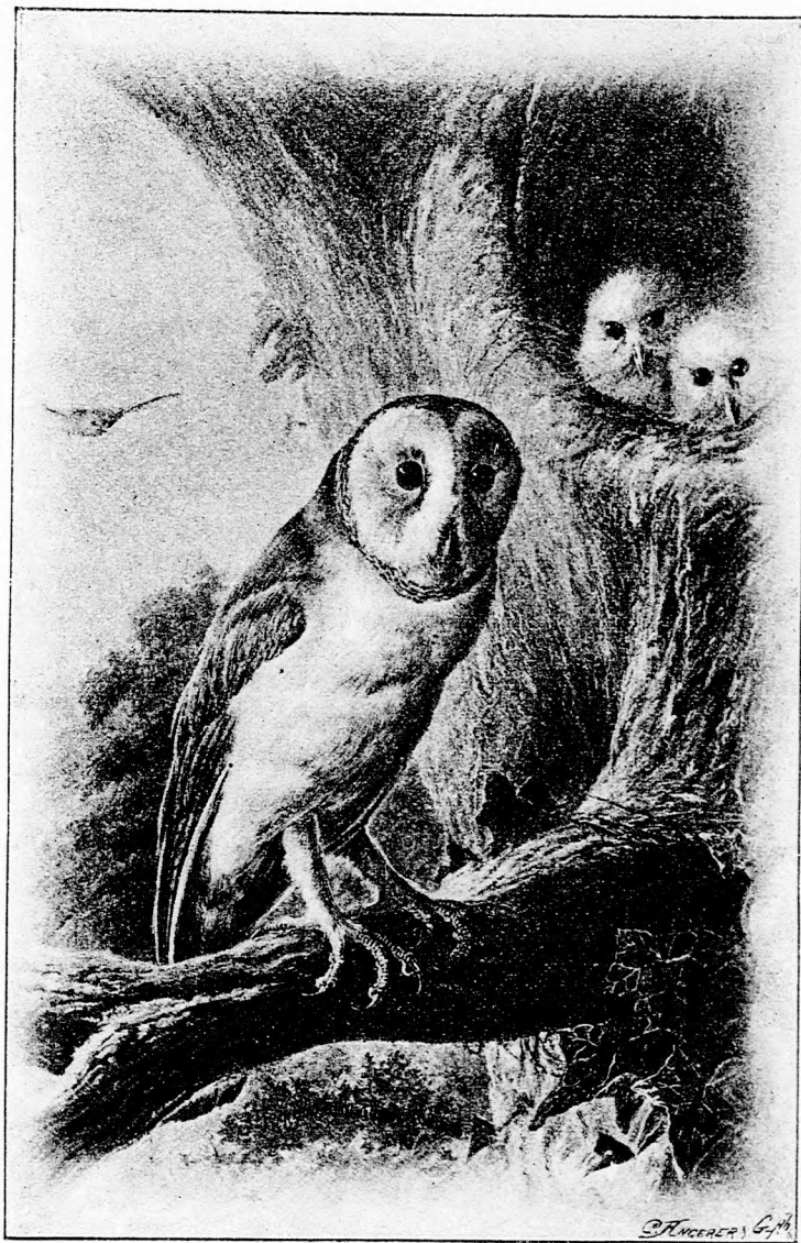
BAGOLY UR ÉS FIAI. (Lásd a 74. lapon.)