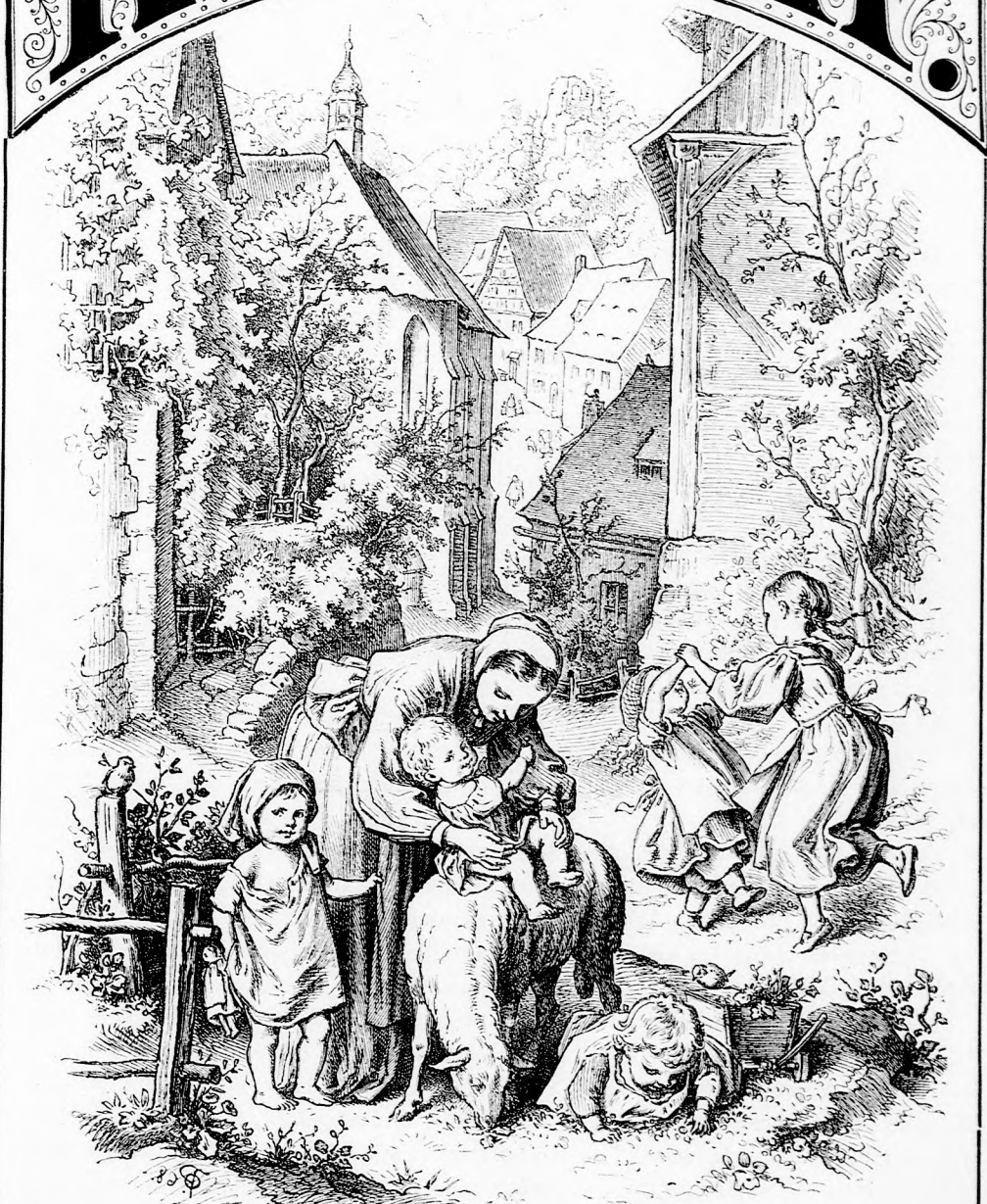
VASÁRNAP DÉLUTÁN. (Lásd a 80. lapon.)