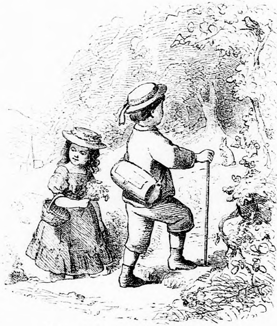
TUDÓS JENŐCSKE. (Lásd a 125. lapon.)

— Ne félj semmit, biztatta pajtását. Nagyon jámbor, szelid állat, nem rüg ki.