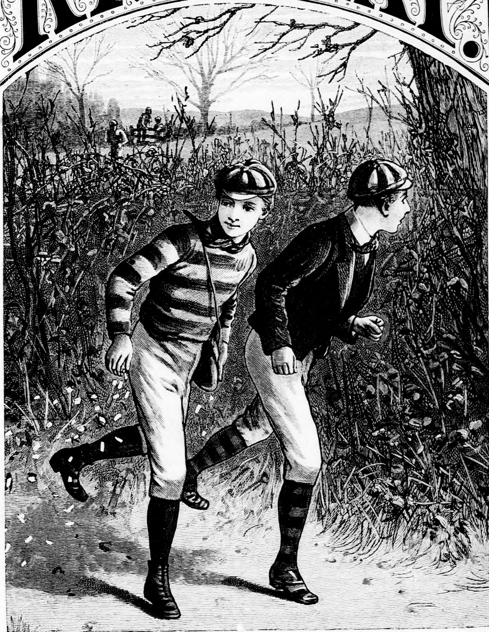
...ŐK TUDTAK LEGJOBBAN FÜTNI. (Lásd a 270. lapon.)