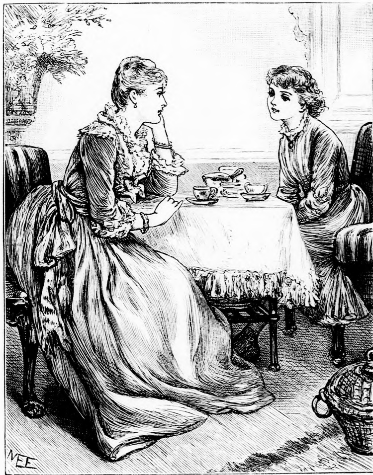
. . . OZSONNÁNÁL ÜLTEK.

— Izlik a esokoládé? Szólt Kamilla rendkívül nyájasan. Igyál kedvesem még egy csészével. . . csak ugy, mint ha otthon volnál. Milyen pompás is volna az, ugy-e, ha mindig itt volnál mellettem!