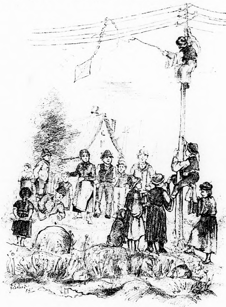
MEGAKADT! (Lásd a 336. lapon.)