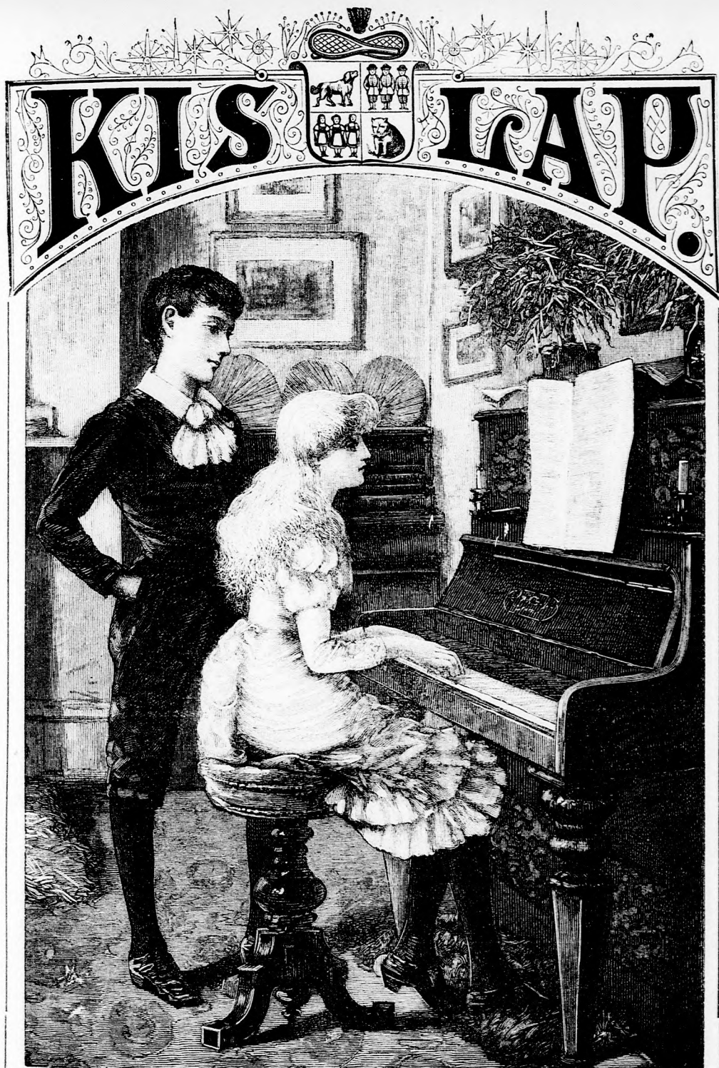
LACZI BAJA. (Lásd a 328. lapon.)