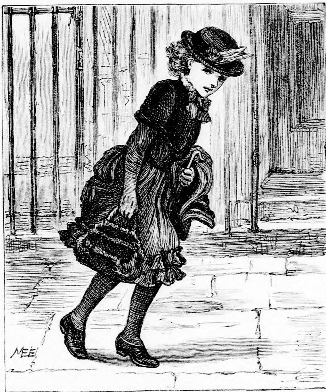
... FUTVA MENT. (Lásd a 323. lapon.)

— No lám, szólt Kamilla gúnyos nevetéssel, és te szerettél volna itt maradni, ugy-e, hogy neked is jusson rész a