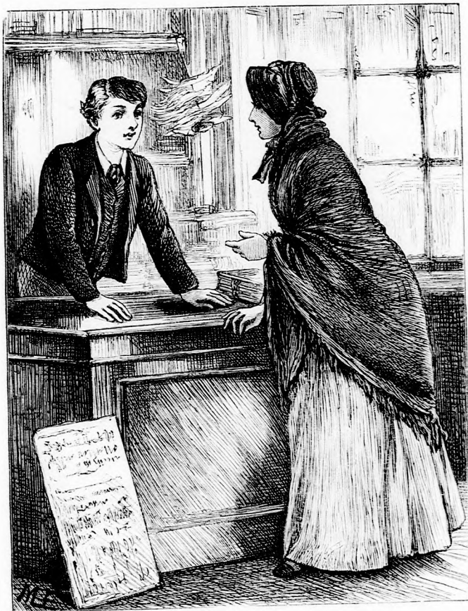
...AZ ASZTALHOZ LÉPETT. (Lásd a 339. lapon.)

— Oh, szó sincs róla. Azt is bizonyosan tudom, hogy éppen tíz éves... még annyinak sem látszik, mert kicsi korától fogva gyenge volt.