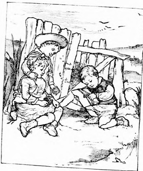
...HALLGATJÁK A GYERMEKEK.