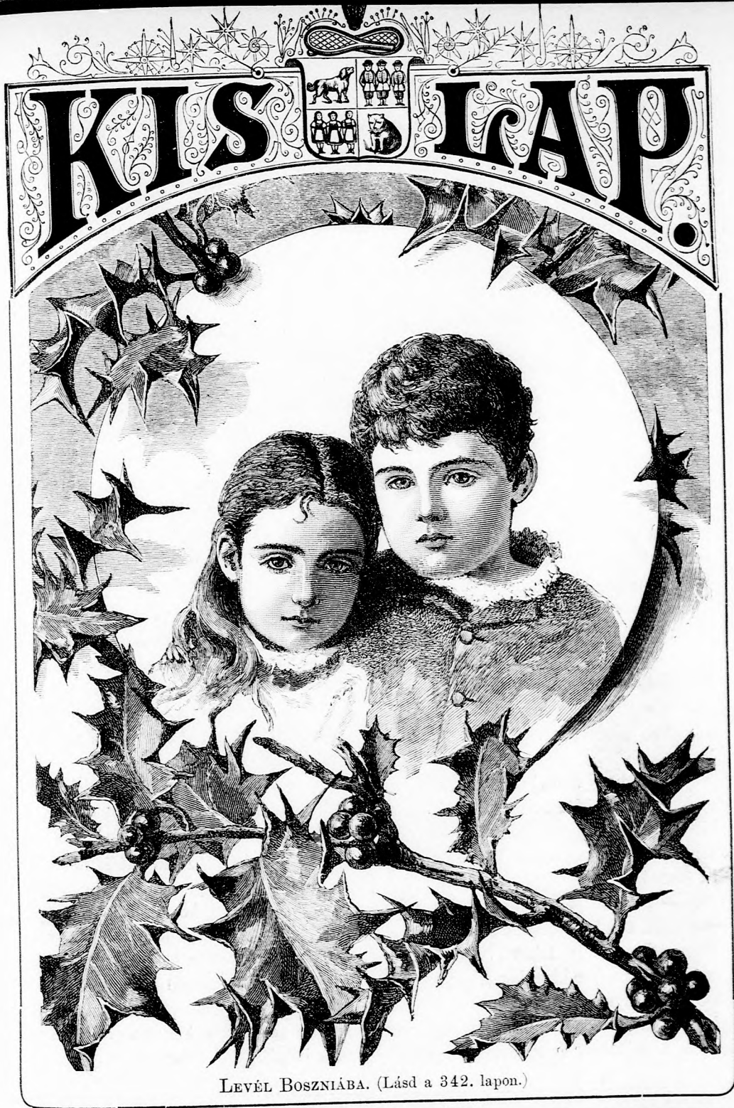
LEVÉL BOSZNIÁBA. (Lásd a 342. lapon.)