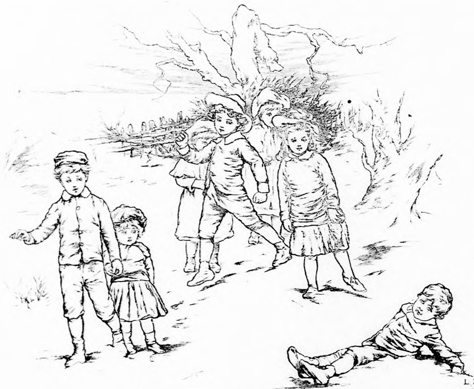
GYURI A HÓBAN. (Lásd a 344. lapon.)

Főzéssel, sütéssel az eszkimó nem bajlódik, hanem nyersen eszi meg a húst és ezért kapta az eszkimó csufnevet, mert