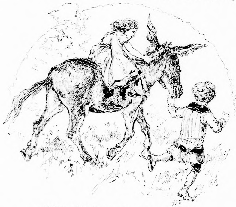
...NYARGALÁSZTAK A MEZŐN. (Lásd a 393. lapon.)