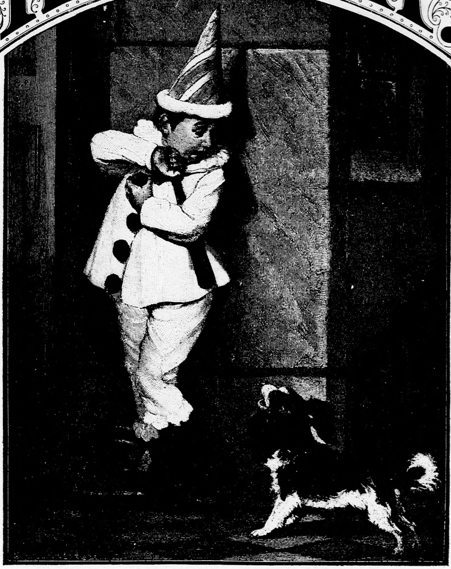
TUPI BOSZUJA. (Lásd a 86. lapon.)