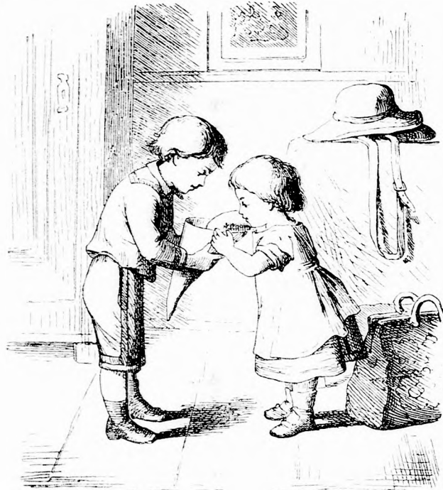
BÜCSUFIA. (Lásd a 94. lapon.)