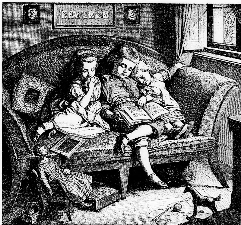
HÁRMACSKÁN. (Lásd a 84. lapon.)

Hanem azt nem is képzeled, kedves Margitkám, milyen nehéz dolog az a tanítás, milyen sokat kell ahhoz tudni! Én azt hittem, hogy ezt a szegény tudatlan fiút könnyen taníthatom, hiszen én már olyan sokat tanultam és tudok, ő pedig semmit. Hanem amint egyről-másról beszéltem