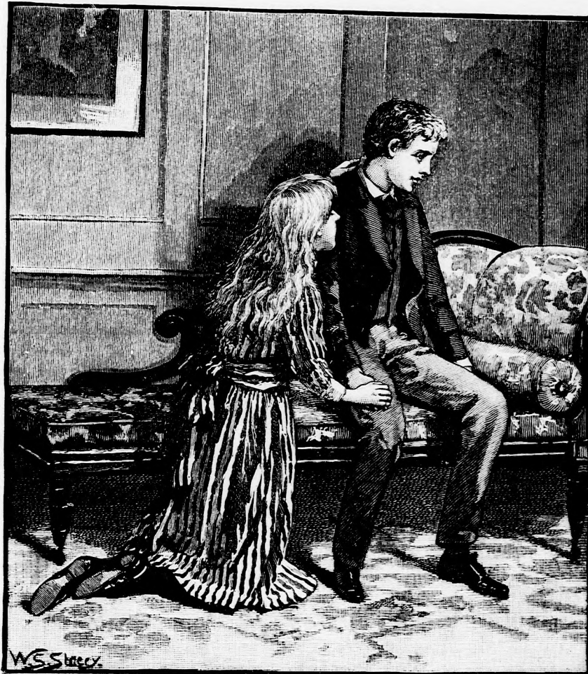
GYÁSZBAN. (Lásd a 182. lapon.)

fény volt ugyan, de semmi szeretet. Kivált szegény Bertinek ugyancsak keserves volt most már ott az élete, mert Gérő bácsi mindinkább érezte vele boszuságát.