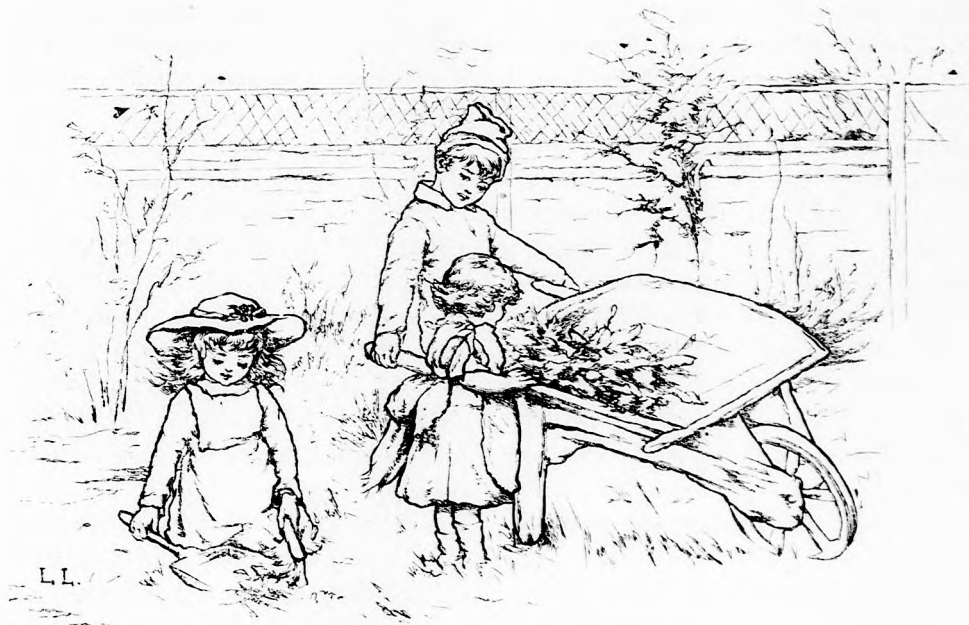
KERTI MUNKA. (Lásd a 187. lapon.)

Volt neki zöld festékje. Fogta a malacot, és bár sivalkodásával erősen tiltakozott a pocza éjjeli nyugalmanak megzava rása ellen, bedörzsölte a festék-