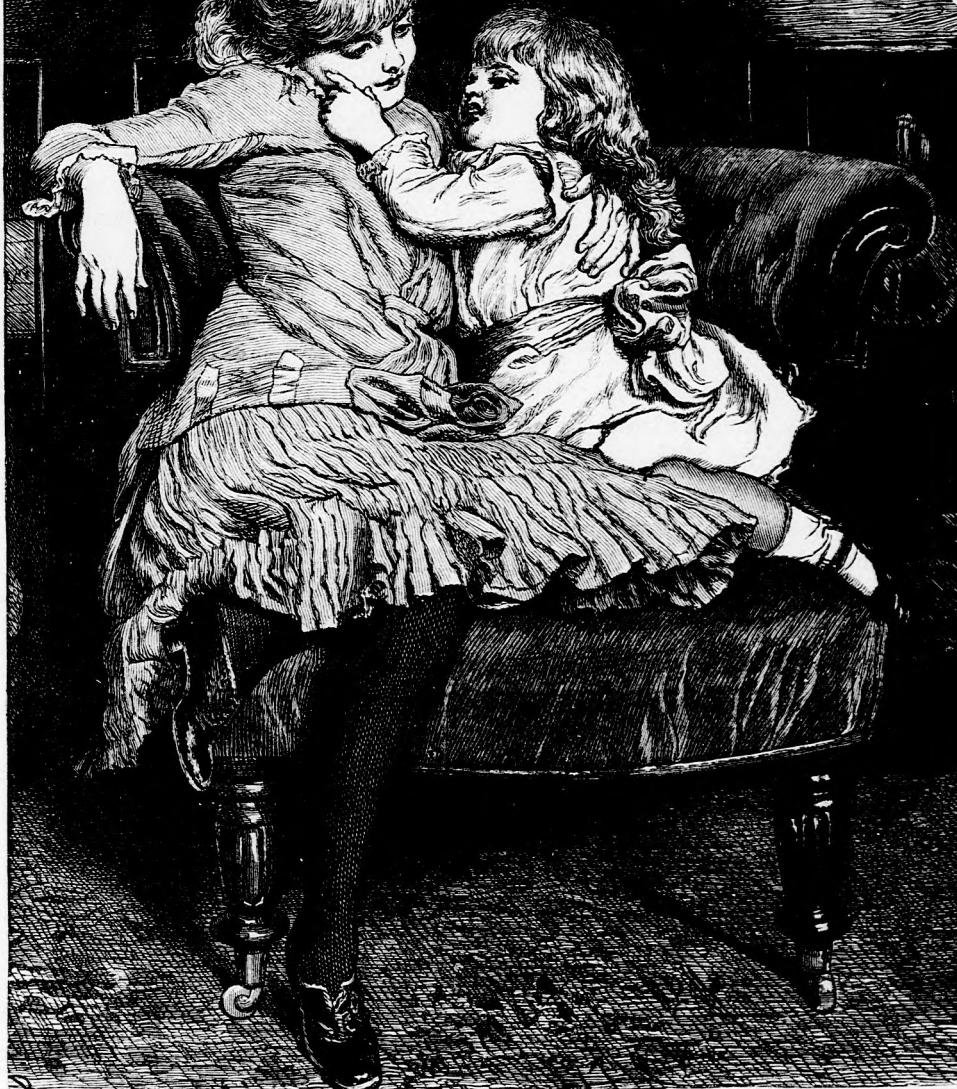
CZIRÓKA, MIRÓKA. . . (Lásd a 198. lapon.)