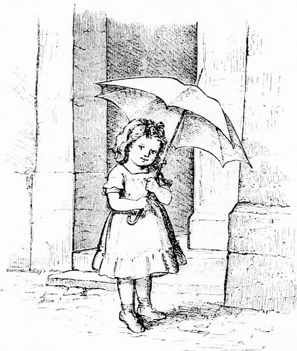
TAVASZI NAPSUGÁR. (Lásd a 202. lapon.)

hogy akkor biz'én rosszat tanácsoltam. Per- sze, ha itthon vagyok, tudtam volna segí- teni, de külföldön jártam sokáig. Mikor végre megtudtam a dolgot, mindjárt el vol- tam szánva, hogy segítek, a mennyire lehet. Csakhogy én nem szeretek ám érdemtelen emberekkel bajlódni, előbb meg akartam