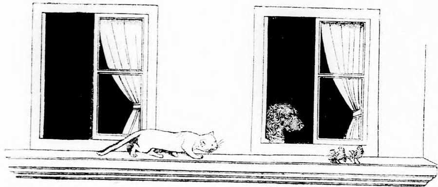
... A PÁRKÁNYON SETTENKEDIK. (Lásd a 199. lapon.)

Volt is öröme a kis leánynak! Összehívta az egész házat, puha meleg kacsói-