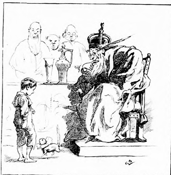
...SIET A GAZDÁJÁHOZ.

— Pompás hangja van, szólt a király elégedetten. És lám, nem haragtartó, vigan siet a gazdájához (Lásd a képet a 268. lapon) magasra emeli farkinczáját, mintha semmi bántódása sem esett volna. Megtartom. Ez lesz a királyi udvari macska.