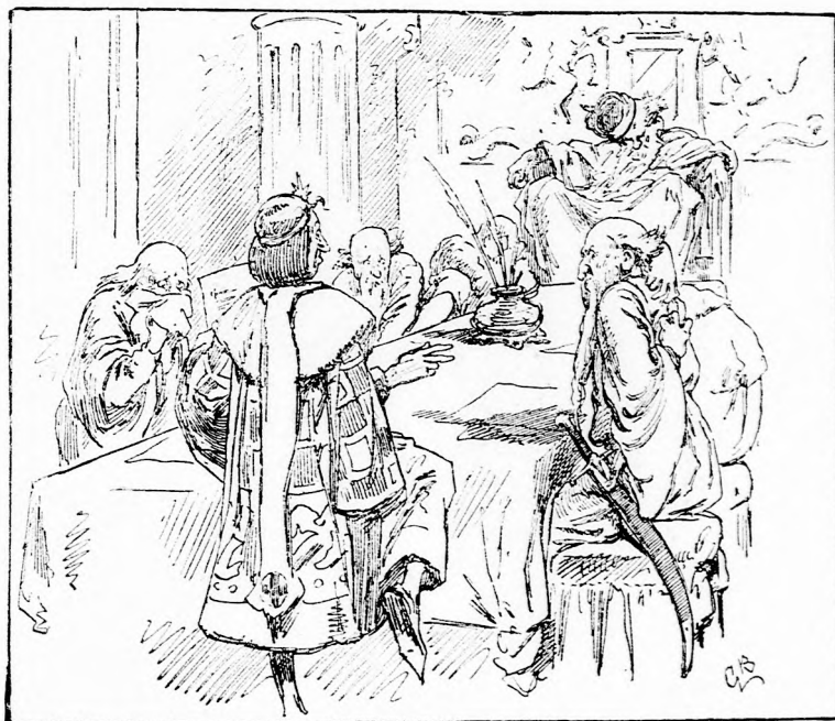
... ODAKAPOTT A HÁTÁHOZ. (Lásd a 271. lapon.)

Mit gondolt Titi, nem tudom, de az bizonyos, hogy fényes urasága kezdetét nem igen szerette. Pompás selyem nyak- ravalót kapott, mely nagyon szép volt, de