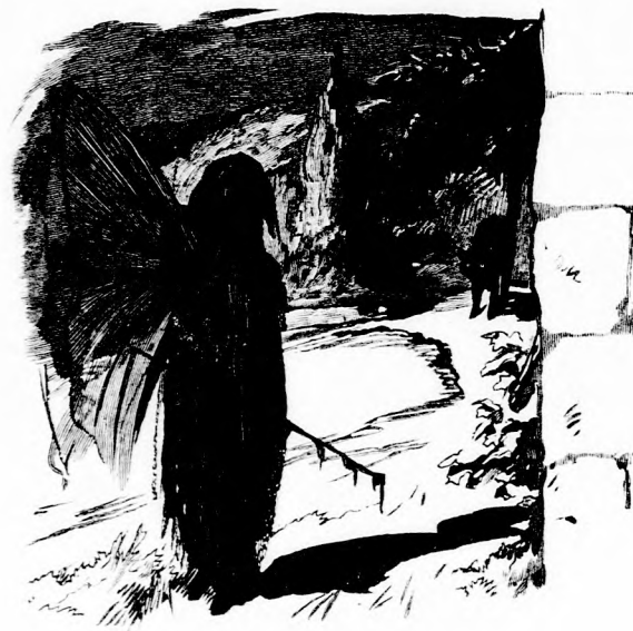
... HARAGOSAN SZÁLLT VELE SZEMBE.

— Valóban, ez a czicza goromba egy czicza, szolt az első miniszter.