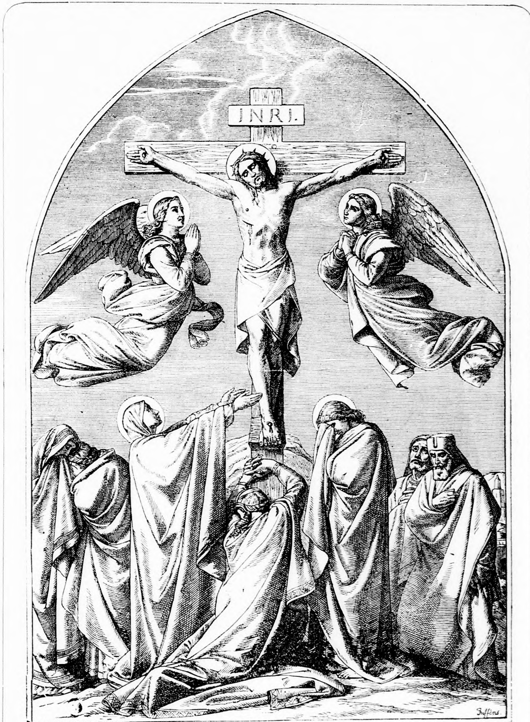
HUSVÉT. (Lásd a 258. lapon.)