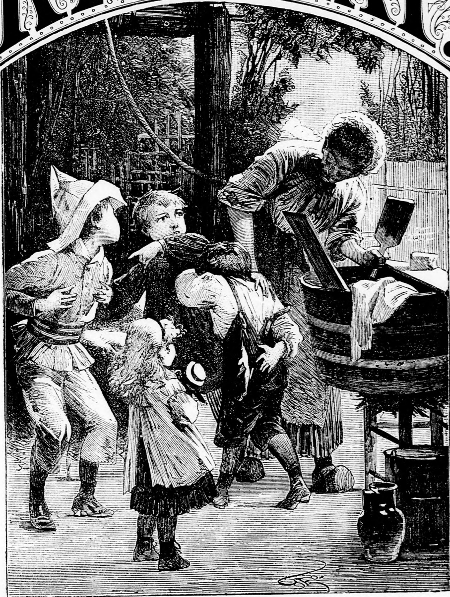
CSATA UTÁN. (Lásd a 285. lapon.)

XXX. kötet, 18. szám. Ára negyedévre 1 frt 40 kr. 1886. május 2-án. Megjelen hetenkint egyszer, 16 oldalon.