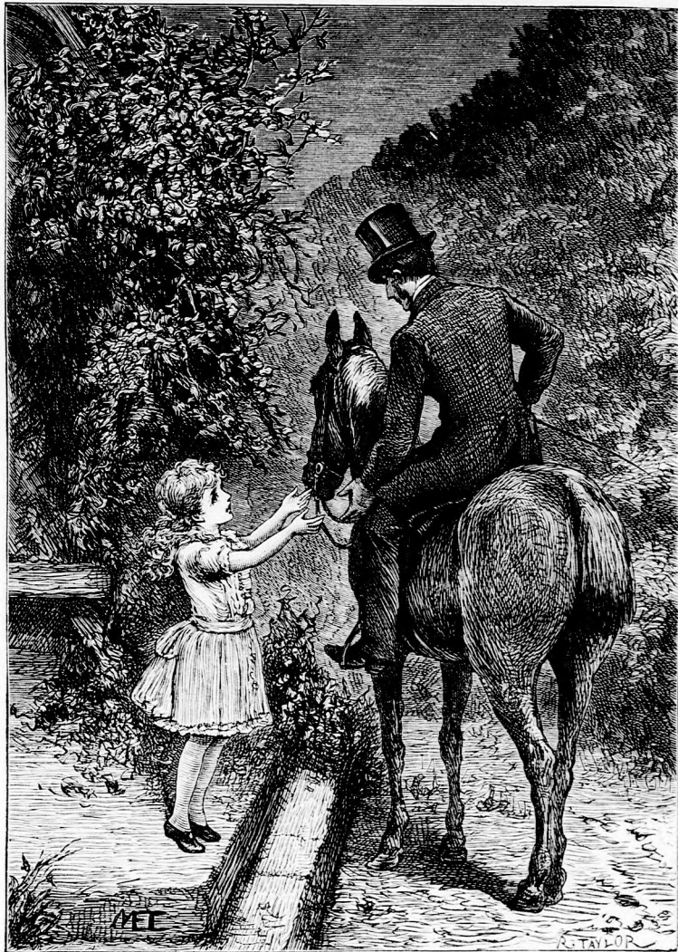
SÉTALOVAGLÁS. (Lásd a 283. lapon.)

— Mert szerencsétlenül jártam. Egy este, mikor megint kötelen kellett tánczol-