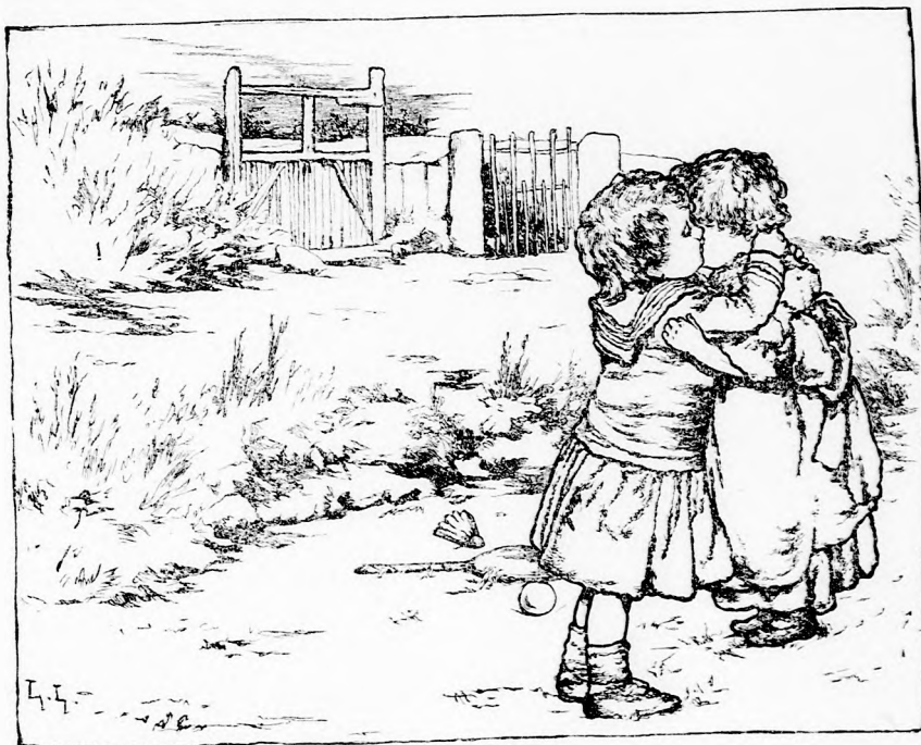
SIRALMAS BÚCSU. (Lásd a 294. lapon.)

csirta fog bennünket fölkelteni. (Kálmán elalszik, Pista mellette marad, s néha fát tesz a tűzre, dudolgatva csöndes zenekiséret mellett régiebb dalokat. El kezd szürkiülni. Madárfütty hallszik az erdő lombjai fölött.) De hamar megvirradt. A hálótársamat föl kell ébresztenem. (Gyöngéden érinti Kálmánt.) Kéljen föl ifuram s menjünk el szüleikhez, kik bizonyára már sokat aggódtak miatta.