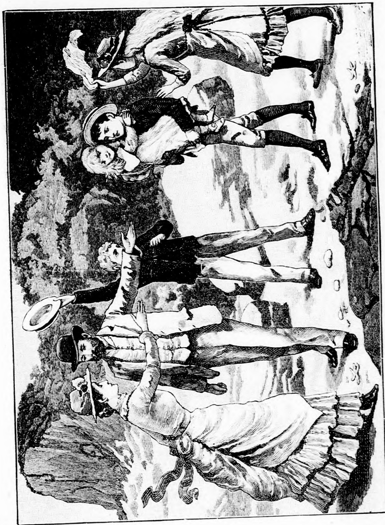
— ITT VAN, NINCS SEMMI BAJA. (Lásd a 319. lapon.)

— Talán vissza ment mamáékhoz... bizonyosan visszament... nincs messze.