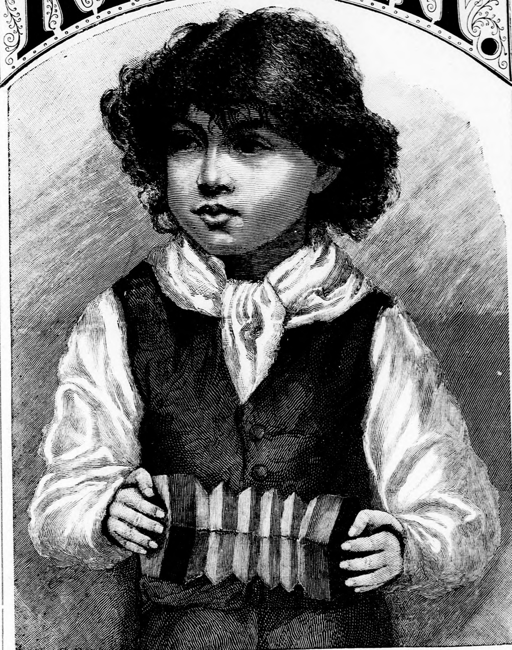
HARMONIKÁS FIÚ. (Lásd a 314. lapon.)

XXX. kötet, 20. szám. Ára negyedévre 1 fnt 40 kr. 1886. május 16-án. Megjelen hetenkint egyszer, 16 oldalon.