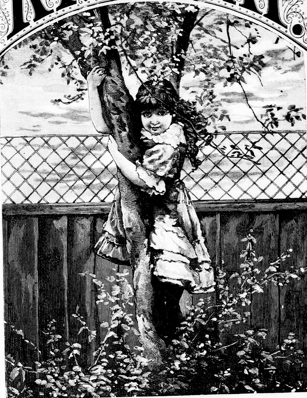
BÖZSIKE A FÁN. (Lásd a 327. lapon.)