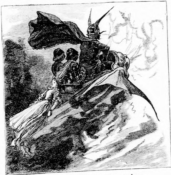
... SZÉLSEBESEN RÖPÜLT ODÁBB. (Lásd a 348. lapon.)