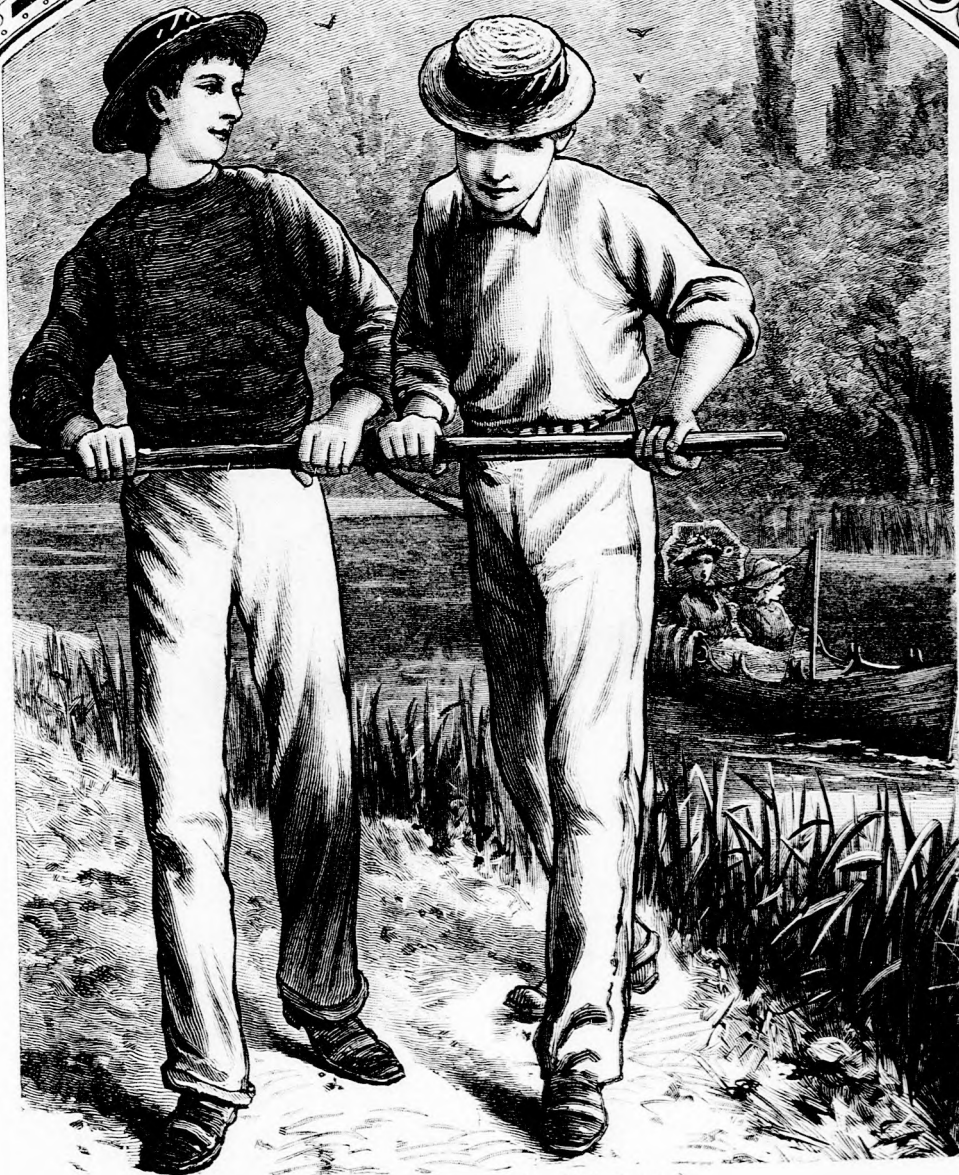
VONTATÓBAN. (Lásd a 342. lapon.)