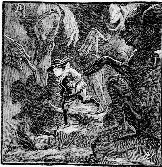
... A BORZALMAS UTON ELŐRE! (Lásd a 351. lapon.)

volna, mint a többi, mindjárt háborut kezdtek volna ellene; de hát erre gondolni sem lehetett. A bűvös sziklafalon nem lehetett sereggel keresztül jutni; ha pedig abba a keskeny sziklahasadékba, az egyedüli utba, bemennek, ott az ellenség egészen kényelmesen lekasabolja egyik vi-