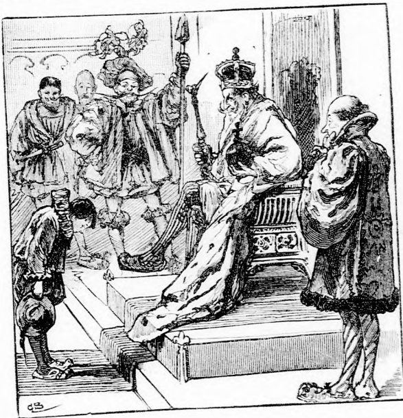
... MEGHAJLOTT A KIRÁLY ELŐTT. (Lásd a 351. lapon.)

Csak egy kis ficzkó volt ott a király udvarában, az nem tudott semmikép belenyugodni. Ez pedig az árva Misike volt, kit a jó király kegyelemből fogadott be és gondoskodott róla. A király-kisasszony is sokszor játszott Misivel, jó és nyájas volt hozzá, Misi tehát nem bírta elszivelni, hogy az ő jötevőinek olyan szomorúságuk legyen.