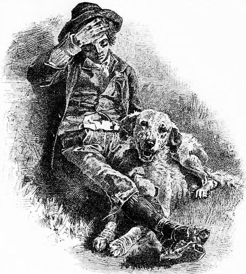
A KÉT HŰ BARÁT. (Lásd a 79. lapon)

hogy vége volt már annak. Senki sem tudta kitalálni, mi lelte, mert nem történt semmi egyéb, mint az, hogy éppen akkor érkezett oda a nézők közé Tibornak az apja. És a mint Tibor megpillantotta