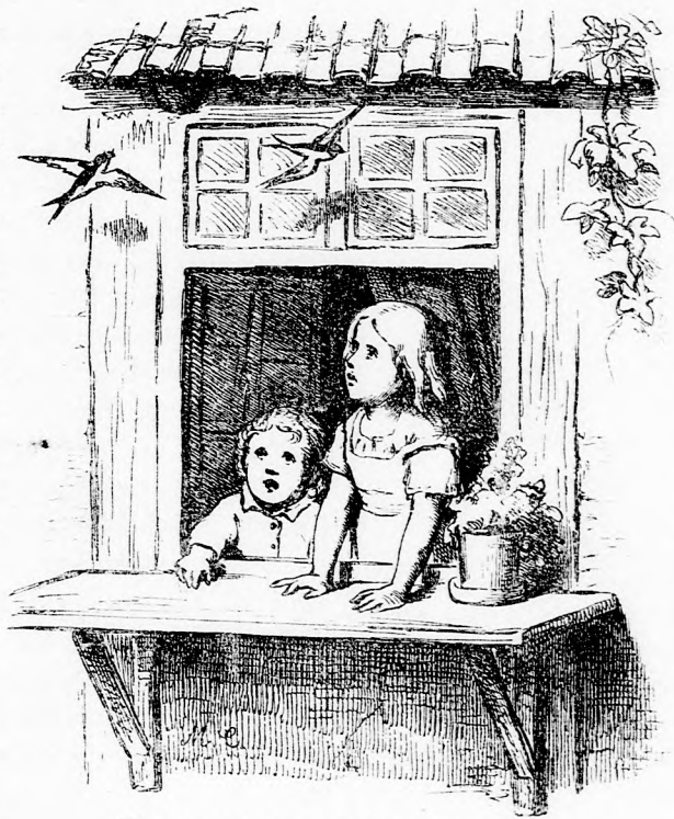
FECSE-FÉSZEK. (Lásd a 70. lapon.)

— No hát akkor hagyjuk jobb időre. Én most álmos vagyok. Hanem az ígéretet megtettem... akár mikor akármit akarsz mondani, bátran mondhatod, én ugyan el nem árulom. Jó éjszakát.