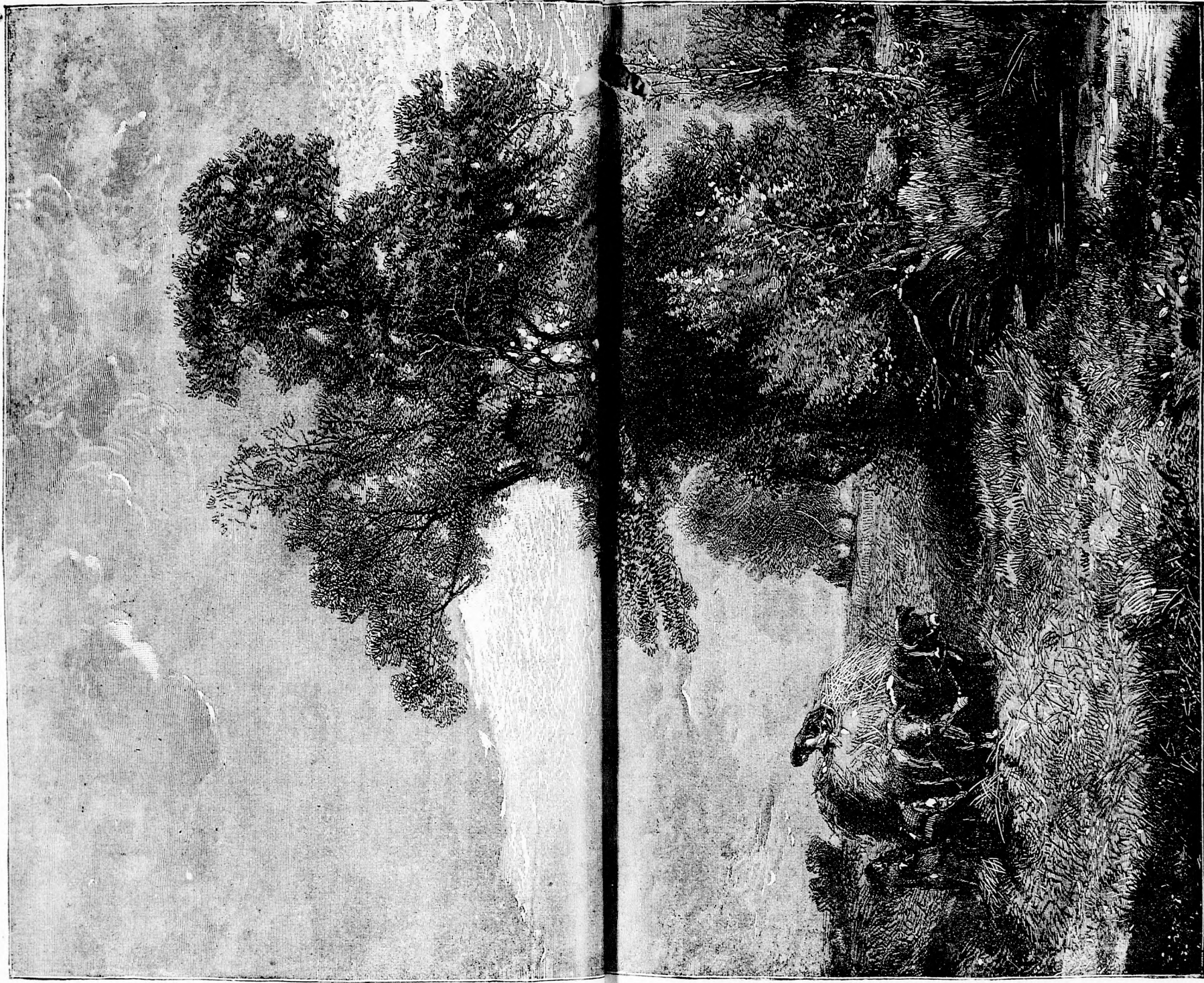
Mocsár szélén. (Lásd a 77. lapon.)