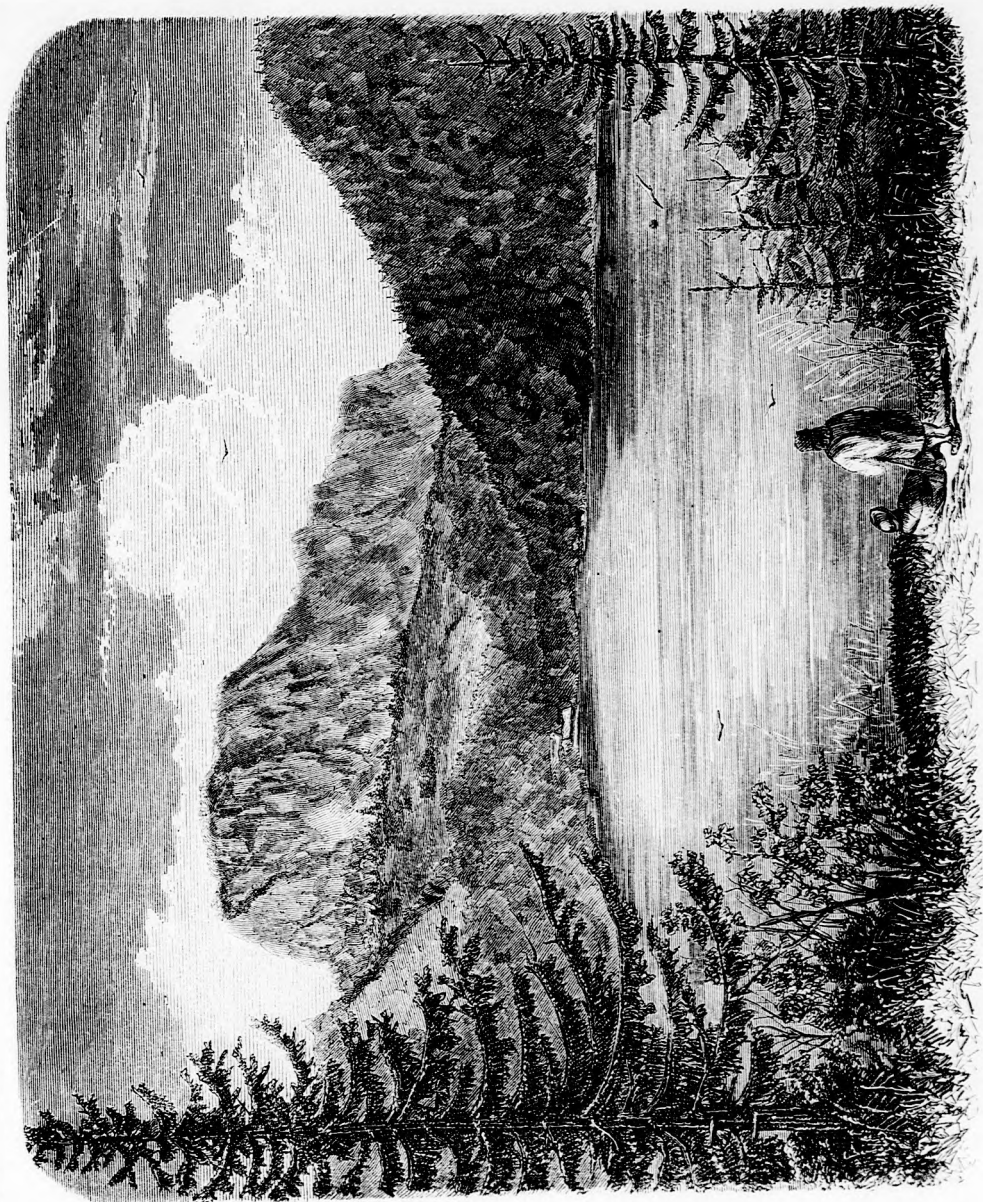
HAZÁNK FÖLDJÉRŐL: A Gyilkos-tó. (Lásd a 101. lapon.)