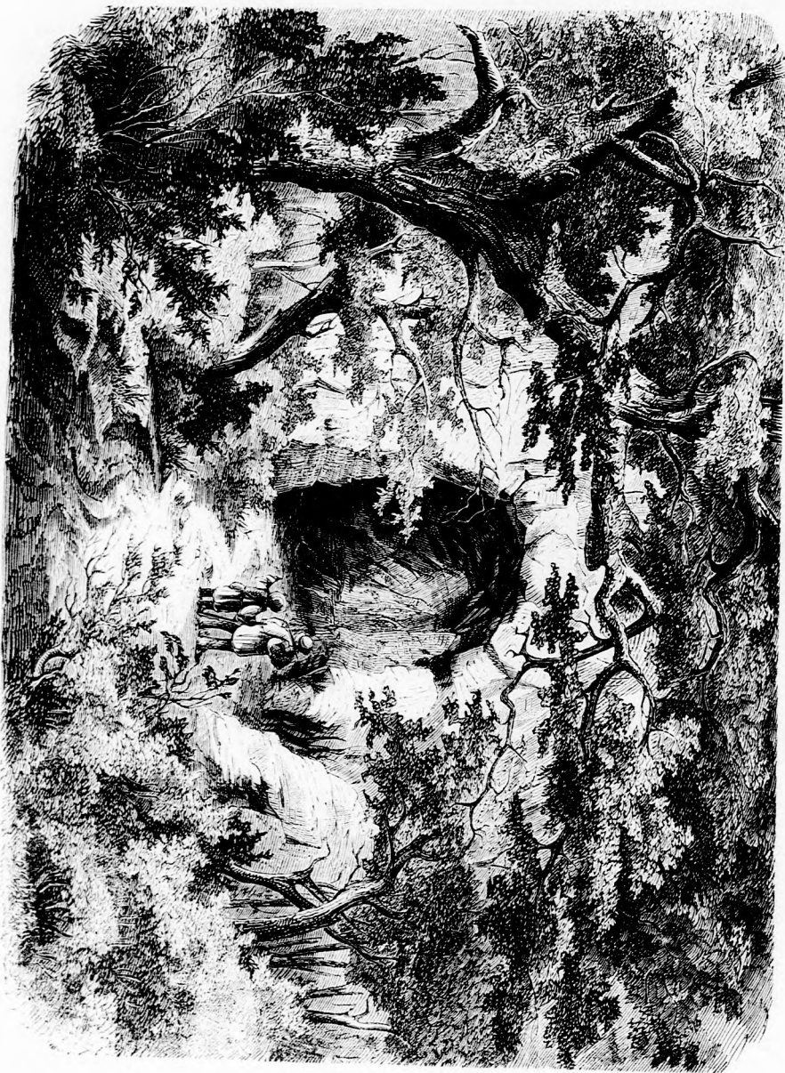
HAZÁNK FÖLDJÉNEK: Az abakigeki barlang. (Lásd a 101. lapon.)