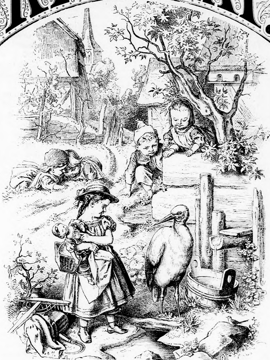
GÓLYA-VEHDÉG. (Lásd a 111. lapon)