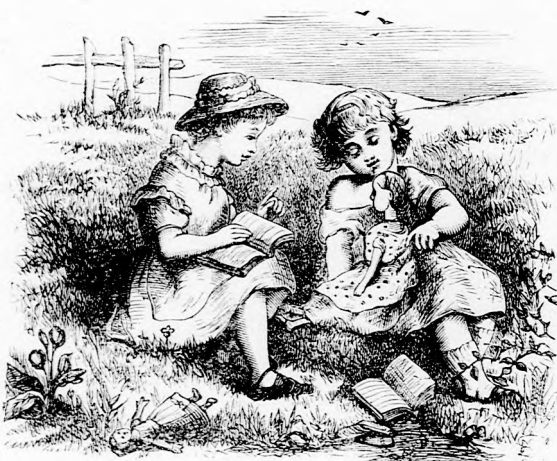
NEM AKAR! (Lásd a 170. lapon)

belőle, csak azt tudta, hogy most már itt a végső percz. Most igaznak és bátornak kell lenni. Vádolják, el akarják ítélni Zsigát, a ki nem éppen a legderekabb fiú ugyan, de ebben a dologban teljesen ártatlan. Ellene szól a látszat, mindenki elhiszi, hogy ő a bűnös és elítéli ártatlanul. Csak ő, Arthur mentheti meg, ha akarja. Tőle függ; ha nem szól, reá senki sem fog gyanakodni, megszabadul minden bajtól.