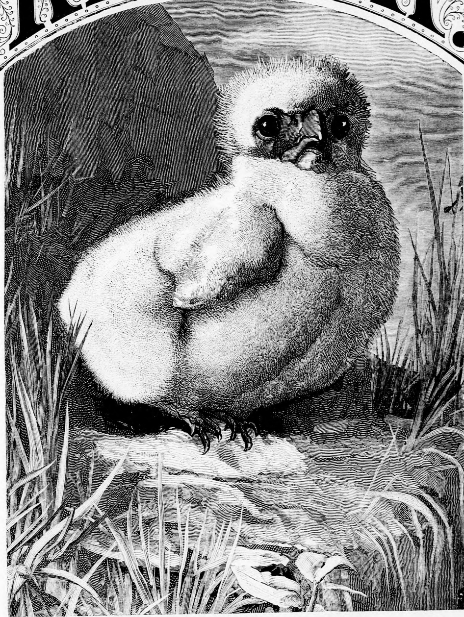
BABAMADARAK. 1. A fiók sas. (Lásd a 170. lapon.)