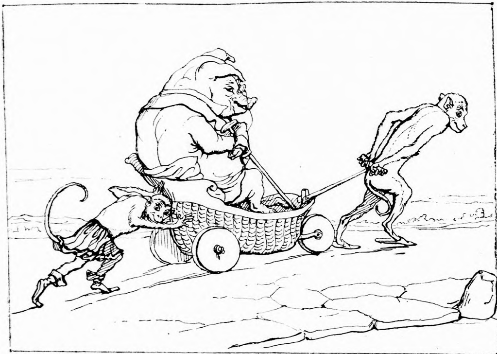
BETEG ÁLLATOK. II. A fogfájós pocza. (Lásd a 214. lapon.)

Mert most még, nem tagadhatom, egy kicsit unalmas az életem. A szomszédba nem mehetek látogatóba, hozzám