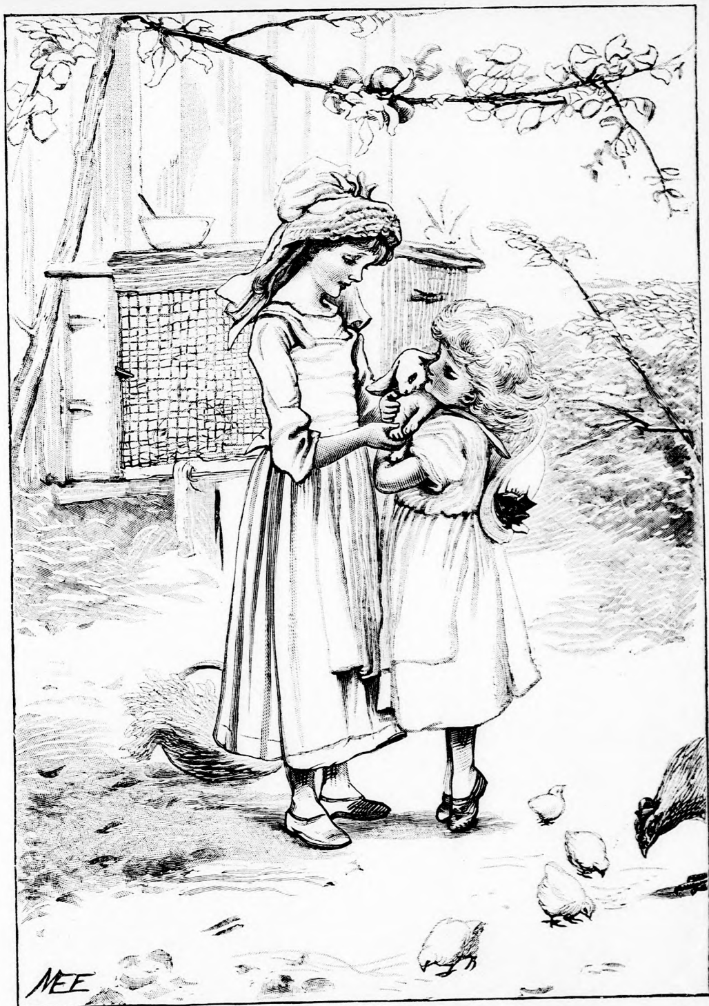
BETEG ÁLLATOK. I. Sérült nyulacska. (Lásd a 214. lapon.)

reset ismert zott a nagy ; de az árva mikor olyan épni. a Lenke kis- Látni akart