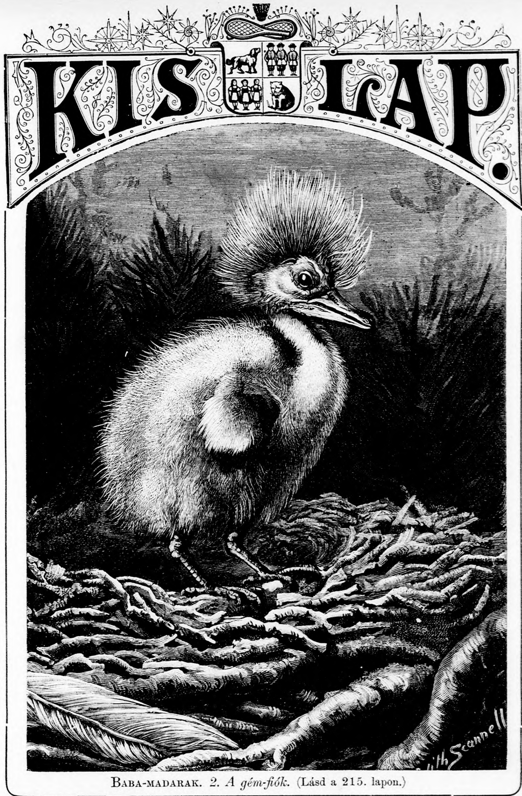
BABA-MADARAK. 2. A gém-fiók. (Lásd a 215. lapon.)