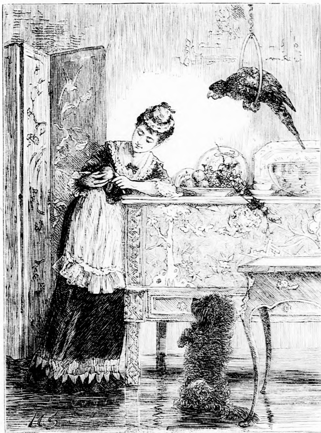
...VAGDAL VALAMIT. (Lásd a 299. lapon.)

Régen volt az, akkor én még kicsike gyermekleány voltam. Örültem is, nem is, mikor egy napon a mamám tudomra