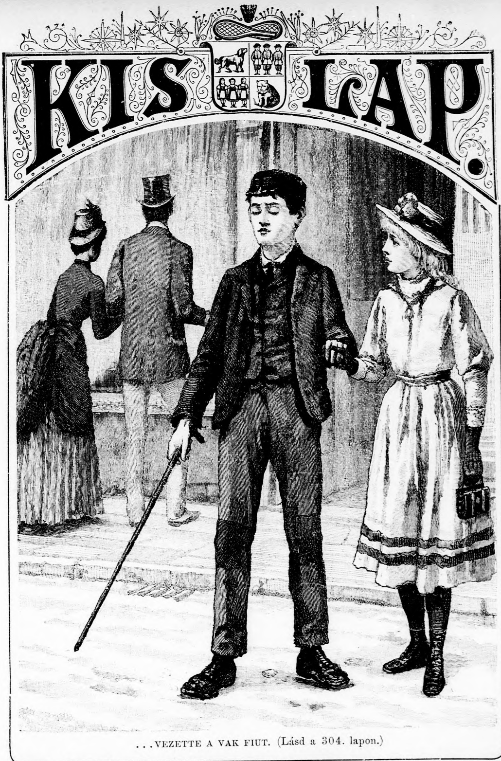
...VEZETTE A VAK FIUT. (Lásd a 304. lapon.)