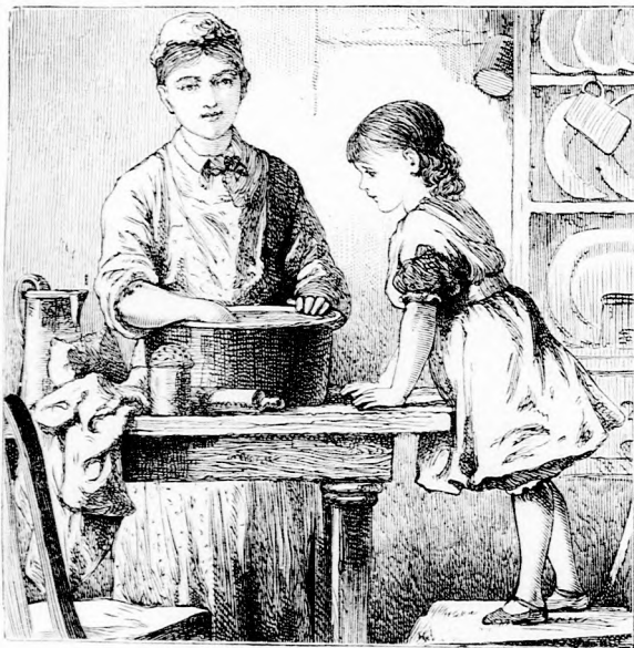
...NÉZTE, MINT KÉSZÜL.