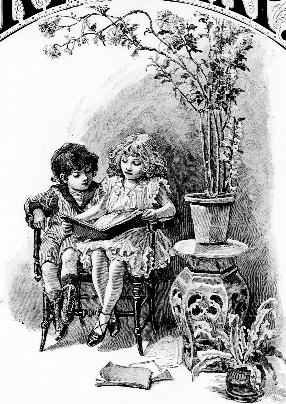
KETTEN ÉS EGYEDÜL. (Lásd a 330. lapon.)