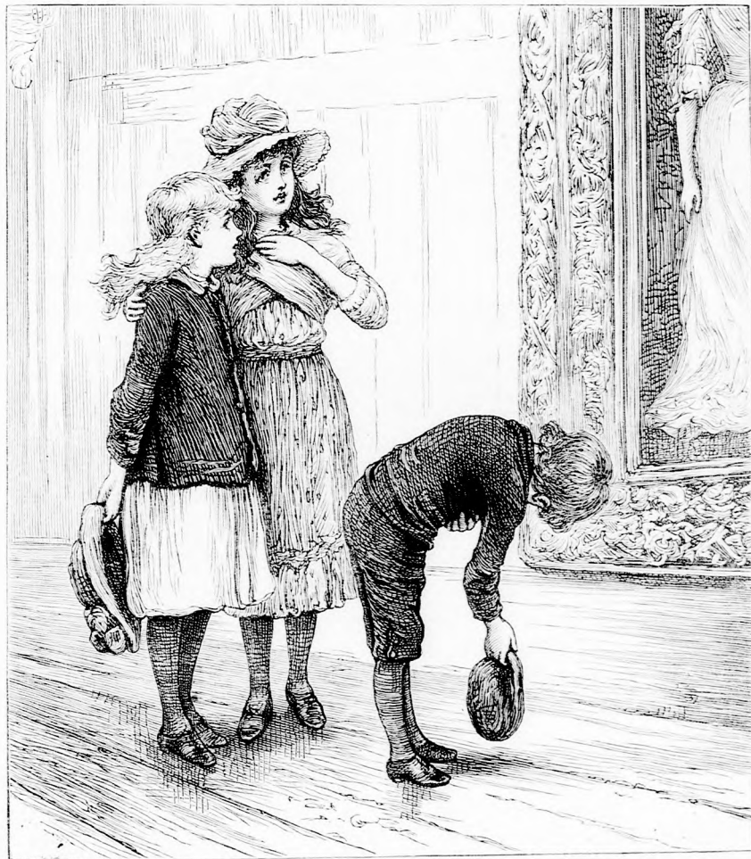
... MÉLY BÓKOT CSAPOTT A KÉPNEK. (Lásd a 342. lapon.)

bejutottunk s végre szétnéztünk. Ha most gondolok rá, persze nem találok semmi különöset abban, amit láttunk; de akkor alig győztük a bámulást. Az igaz,