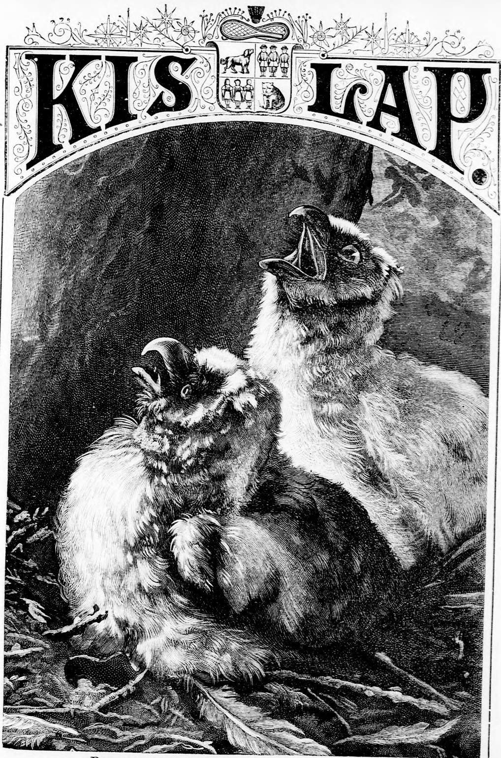
BABA-MADARAK. 4. Bagolyfiak. (Lásd a 343. lapon.)