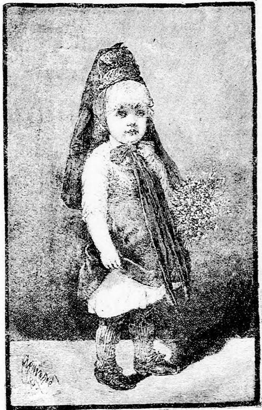
KATICZA. (Lásd a 382. lapon.)

— No azért csak ne busulj, kedves leányom. Majd holnap más módot keresünk.