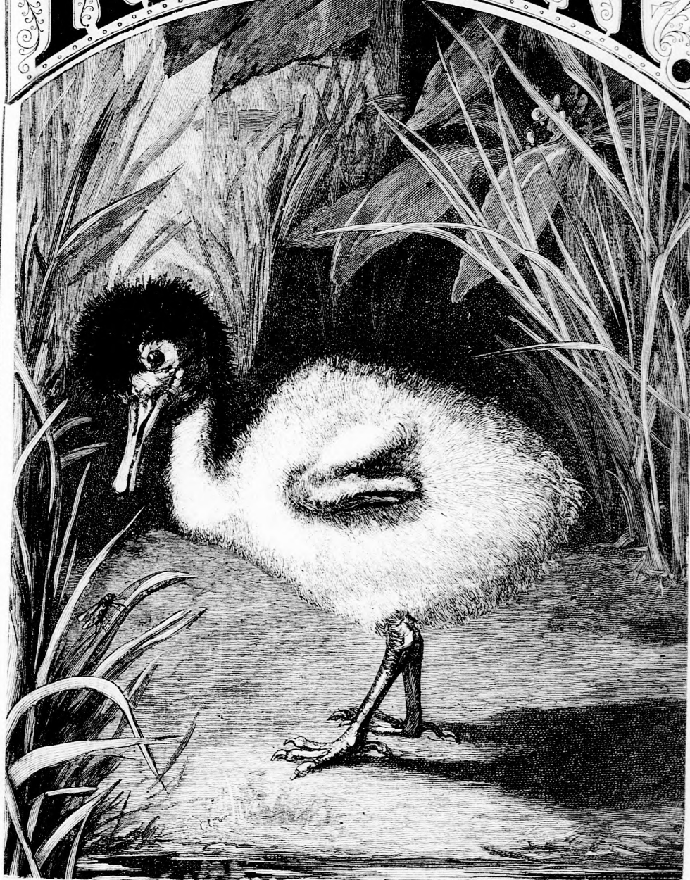
BABA-MADARAK. 5. Ibisz-fiók. (Lásd a 390. lapon.)