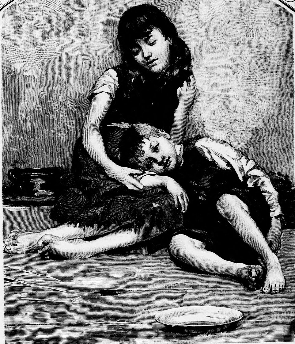
... ÖLÉBE VETTE A FEJÉT. (Lásd a 8. lapon.)