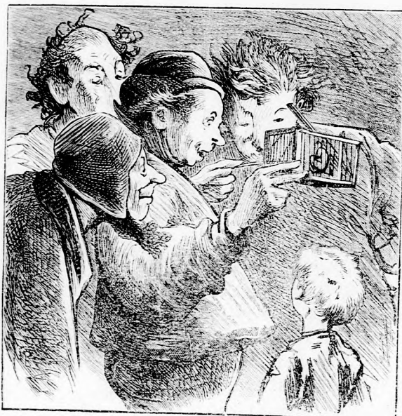
..NÉZTÉK ÉS BOSZANTGATTÁK...

— De nem ám, szólt a komédiás. Levágtam a szárnyait, nem röpködhet el. És ha szárnyát elvesztette, akkor oda a hatalma is.