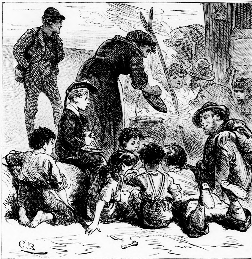
...LAKOMÁZOTT A CZIGÁNYOKKAL. (Lásd a 25. lapon.)