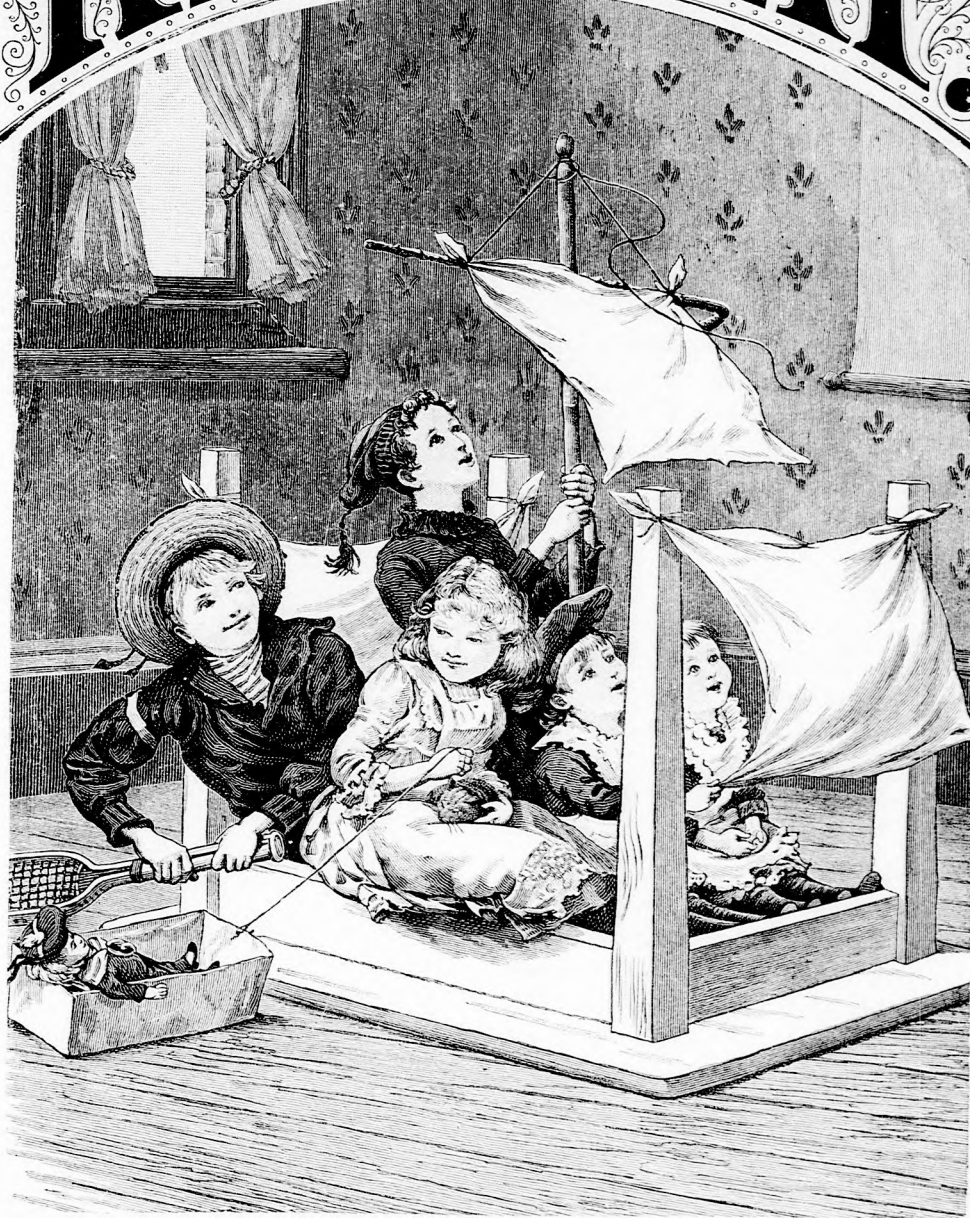
EL AMERIKÁBA! (Lásd a 27. lapon.)