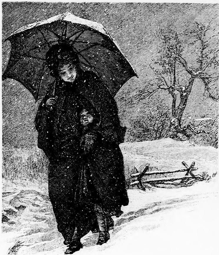
TÉLI UT. (Lásd a 26. lapon.)