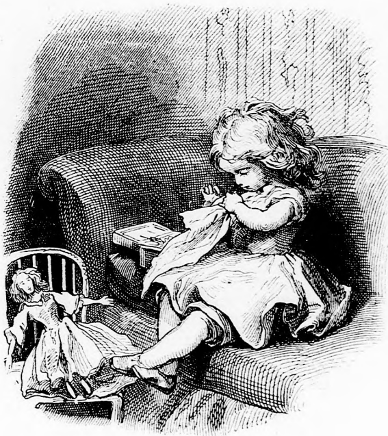
GONDATLAN BÁBU. (Lásd a 118. lapon.)

módján. Ha itthon volt is, nem látták napokig, hetekig, mert a szobája a háztulso végén volt s onnan még ebédre sem jött elő. A kis Lenke nem is volt benne bizonyos, valjon a bácsi szokott-e ebédelni; annyi igaz, hogy néha vacsora idején ette az ebédet, mert jaj lett volna annak, a ki őt tudós munkálkodásában zavarni merte