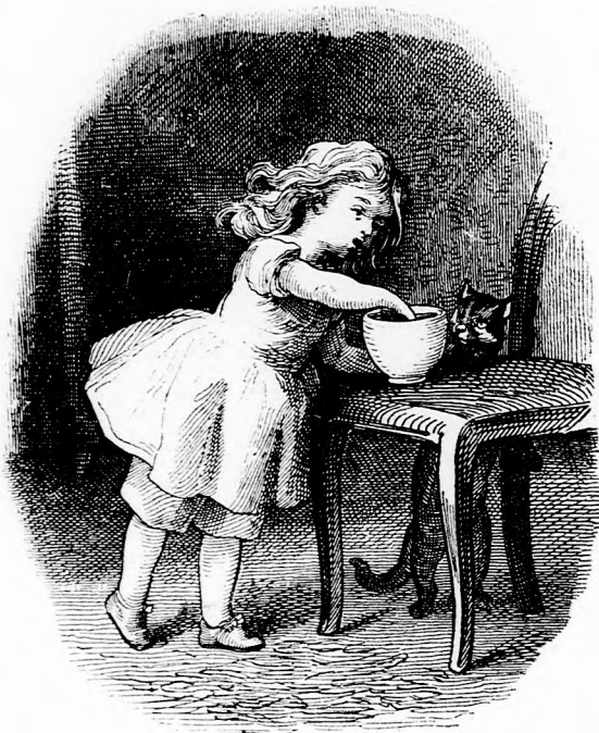
Csalódás. (Lásd a 126. lapon.)