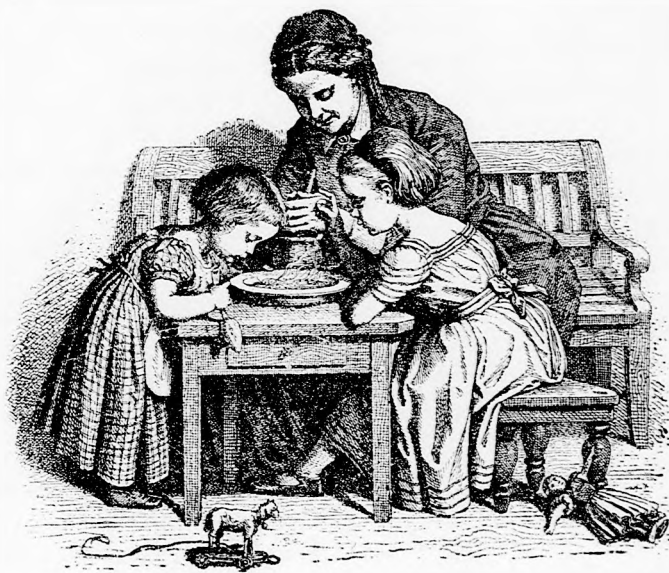
FORRÓ LEVES. (Lásd a 135. lapon.)