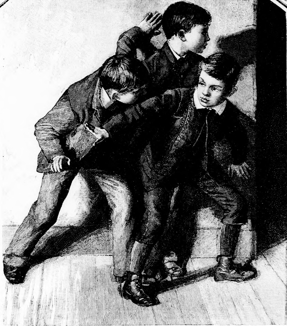
LESBEN. (Lásd a 173. lapon.)