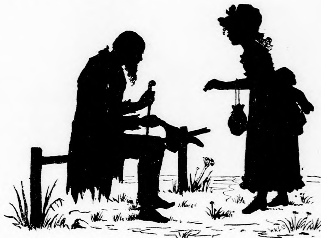
JÖSZIVÜ ADAKOZÓ. (Lásd a 166. lapon.)

Mindnyájan örültek a szép tervnek és mindjárt ki is tüzték az órákat, mikor