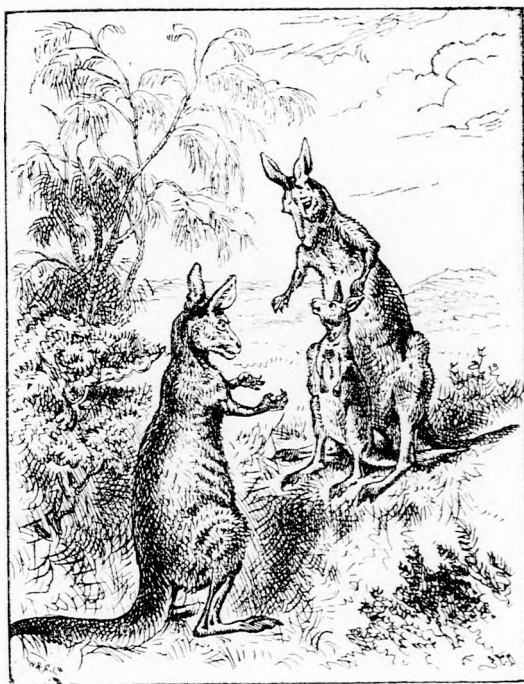
... ANYJÁHOZ ÁLLVA VÁRTA.

— Teljesen igazad van, anyjok. Nagyon ideje, hogy már tanuljanak valamit. Eddig csak legelésel és játékkal töltötték a napot és ha futni kellett, bebujtak a zsáckóba és vitették magukat. Pedig már nagy kamaszok. Jöszte csak