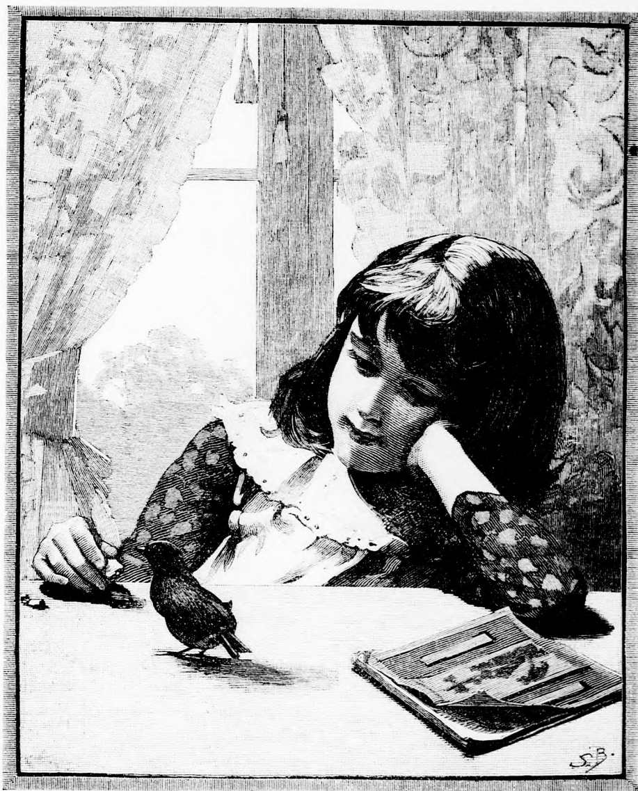
. . . KEZÉBEN TARTOTT ELEM ELESEGET. (Lásd a 187. lapon.)

Mikor Berezi így mérgelődött magában, csakugyan haragudott. A szomszédban töltött napok alatt eleget hallotta, mit tartanak az emberek az öreg különöz-