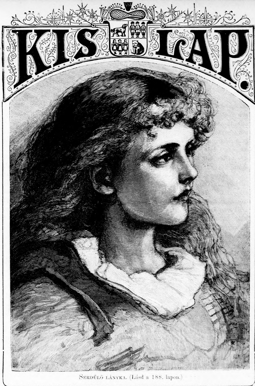
SERDÜLŐ LÁNYKA. (Lásd a 188. lapon.)