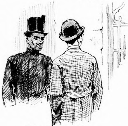
...MEGVETŐLEG FORDULT EL. (Lásd a 247. lapon.)