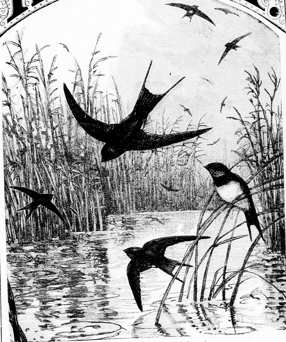
PARTI FECSKEK. (Lásd a 254. lapon.)