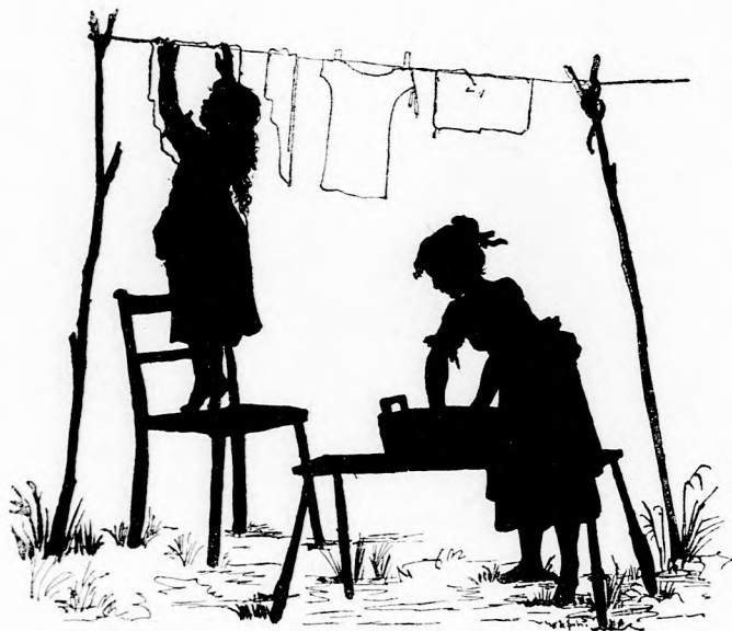
MOSÁS. (Lásd 254. lapon.)

Sokat tudnék róla elbeszélni, de most csak azt mondom el, miként állt boszut ez a madár.