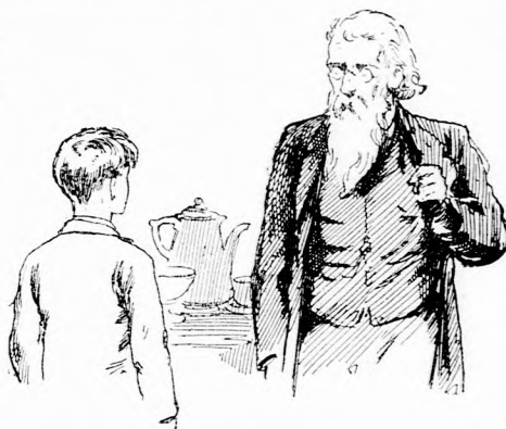
...NEM SZABAD BEMENNED. (Lásd a 246. lapon.)

lek, hogy járj nagyon csöndesen és ne menj be a mamához, mert ezzel fölizgatnád.