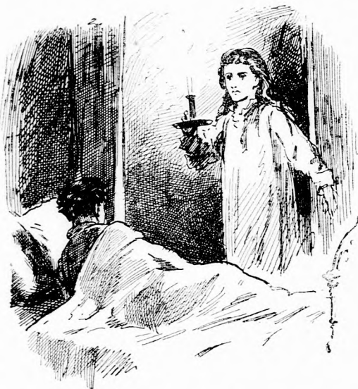
...KEZÉBEN GYERTYÁVAL. (Lásd a 245. lapon.)

György ez este is, mint nagyon sok-szor, boszusan és elégtlenül feküdt le. Meg volt győződve, hogy mindenki üldözi. Hogy valami egyéb baj is lehetne, arra nem gondolt. Aztán elaludt és nem tudott semmiről, nem hallotta, hogy késő éjjel ajtók nyílnak, emberek jönnek-mennek,