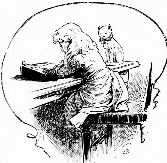
... A CZICZA ODAÜLT ÉS NÉZTE. (Lásd a 311. lapon.)

— Hát bizony nem egészen olyan urfi, mint itt volt. Nem olyan piros-pozs-