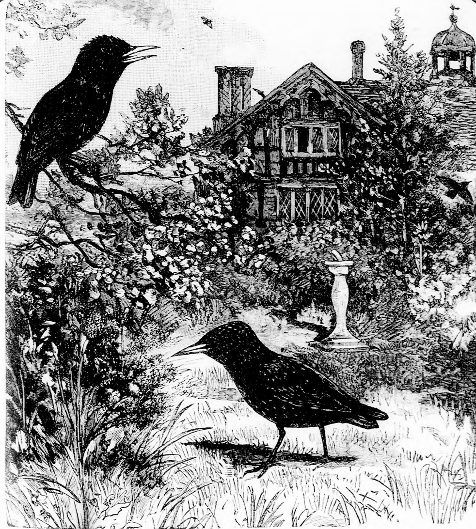
SEREGÉLYEK. (Lásd a 335. lapon.)