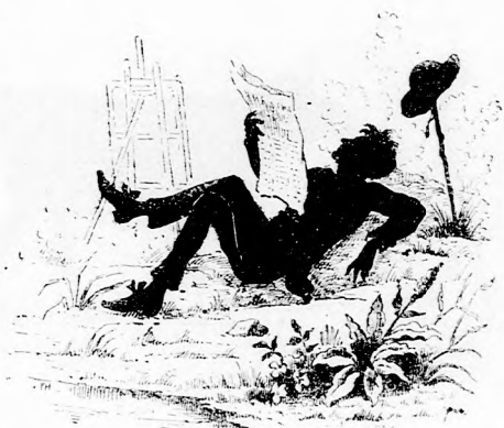
S boldogan belé nyugodva A sikerült mübe, Ujságlapot olvasgatva Lefekszik a föbe.

és mosolygott; de a kisebbek annál inkább megbámulták az új társat, a ki olyan gazdag, sokat tud és csak úgy félvállról beszél az egész intézetről. Még inkább megszerették, mikor kiszedte a ládából holmiját s legelőször is tömérdek jó csemegét, melyből bőkezűen osztogatott mindenkinnek. Egész kis csapat volt aztán körülötte, örvendve a Kornélia barátságának és világlátott tudományának. Mert