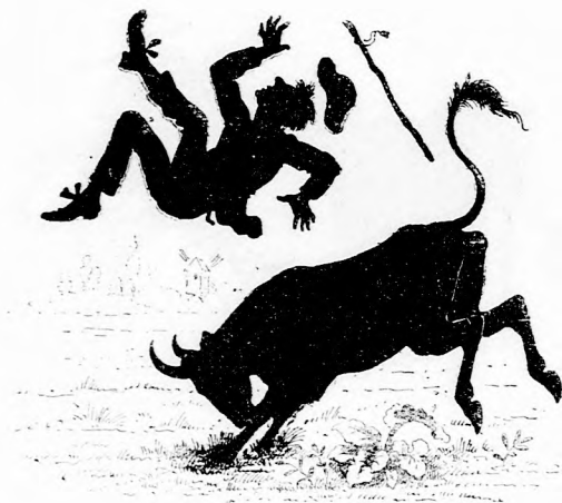
A tehénke sem számár ám, Hogy az ütést tűrje — Felökléli a piktort, s ez Lefordul a fűbe.

— Igen, de az igazgató mondta, hogy nem sokára indulunk.