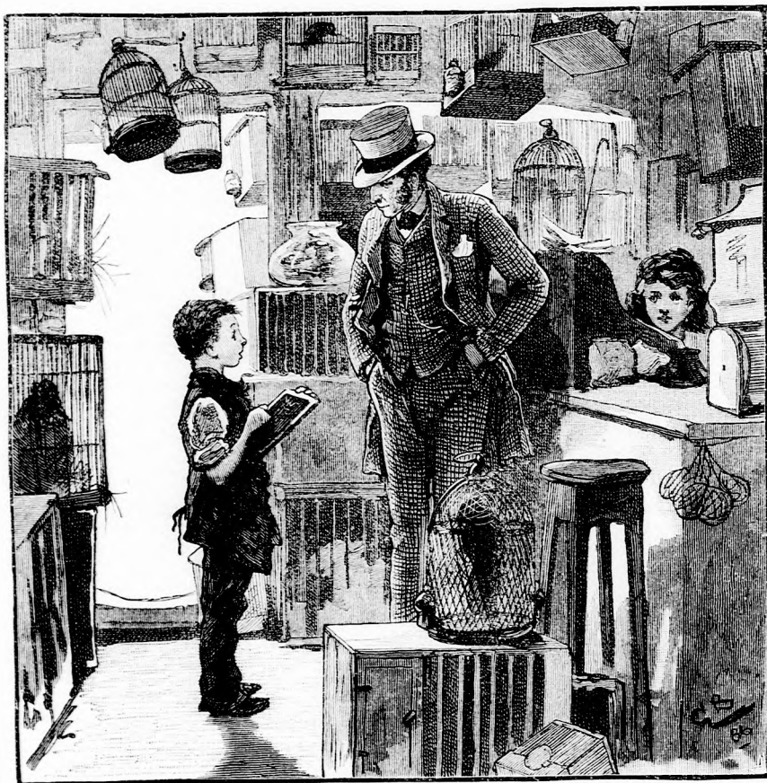
...AZ IDEGEN ELÉ ÁLLT. (Lásd a 339. lapon.)

dolhatott egyebet, mint hogy valami gonosz boszorkányság történt vele. Csak-hogy az öreg kereskedő nem akart efféle-ben hinni, hanem így szólt: