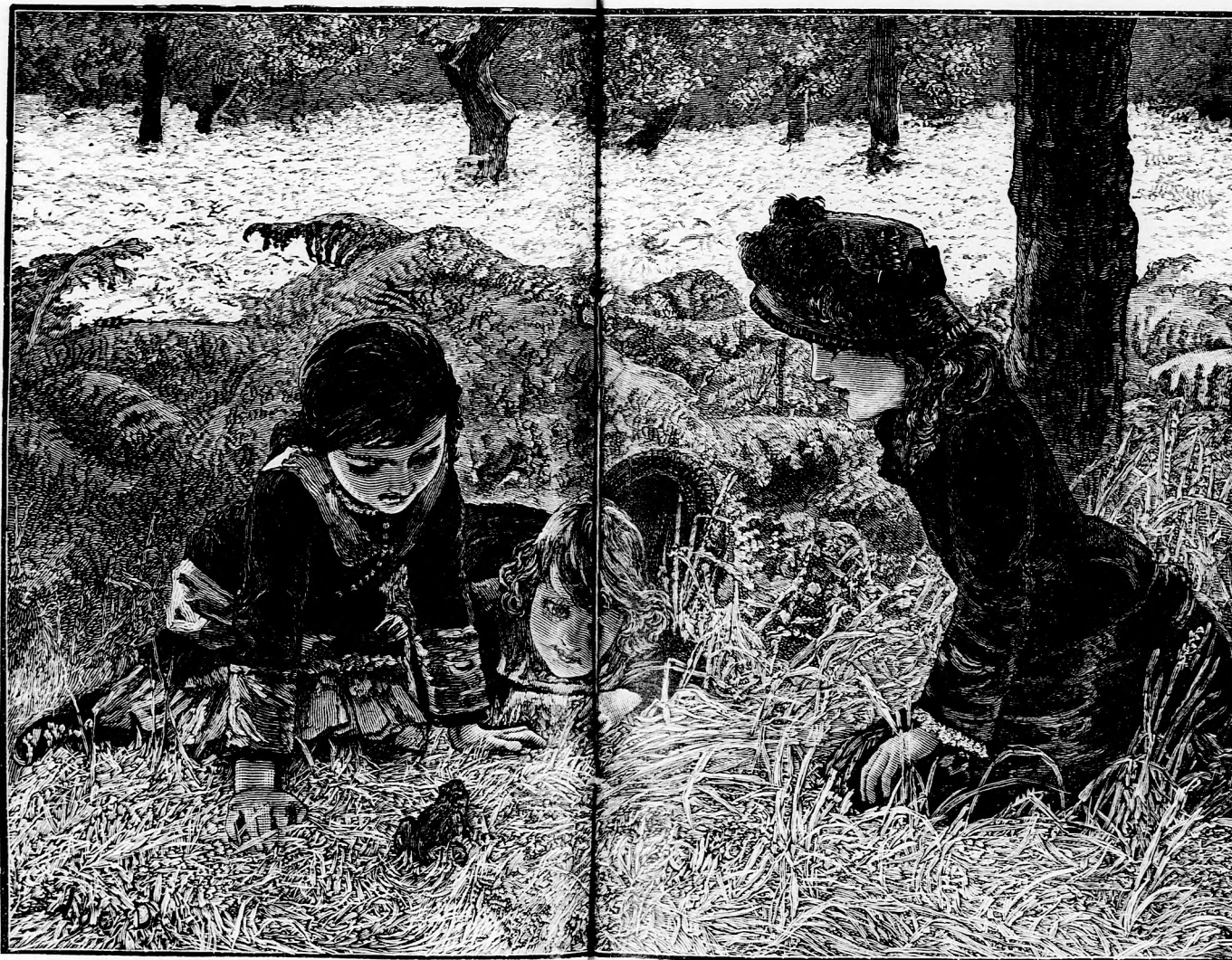
... FARKAS SZEMET NÉZI EGYMÁSSAL. (Lásd a 343. lapon.)

Most már a gyerekek szinte megszerették a furesa állatot és szorgalmasan fogdosták neki a jó kövér legyeket. A