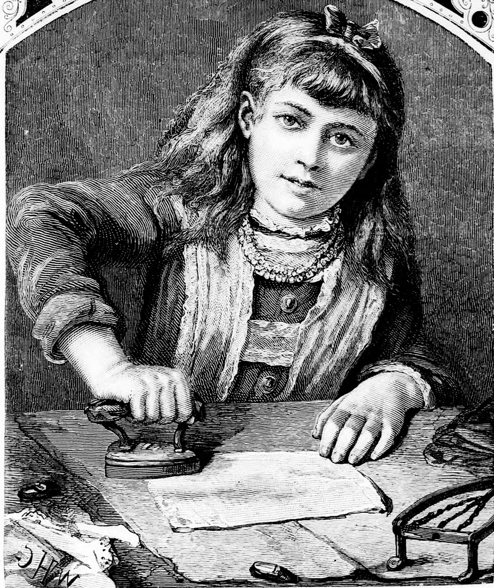
VASALAS. (Lásd a 343. lapon.)