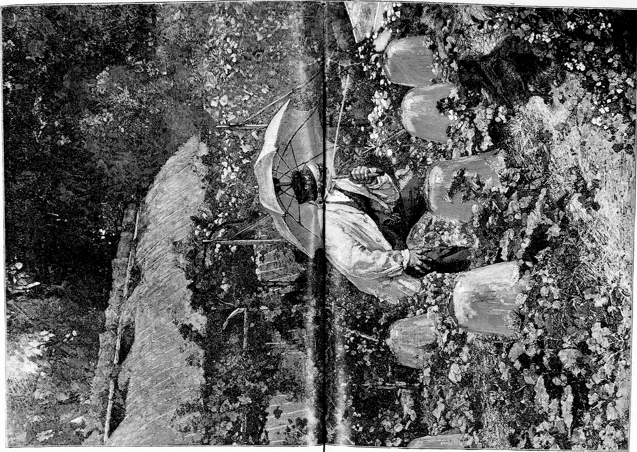
NAGYAPA KEDVENCZEI. (Lásd a 382. lapon.)