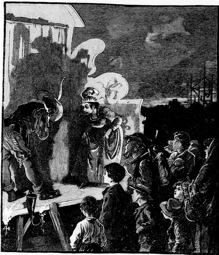
...A VITÉZ ÉS ...A KIRÁLYNÉ. (Lásd a 374. lapon.)

jól tudta, hogy ez nem lehet, mert azt is jól tudta, hogy ő teljesen árva.