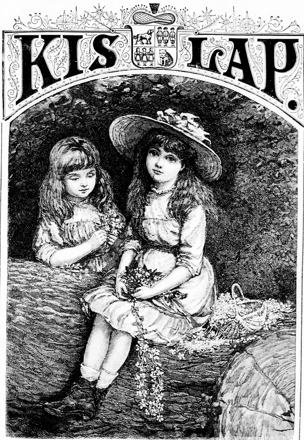
VIRÁGOS KÖSZÖNTÉS. (Lásd a 374. lapon.)