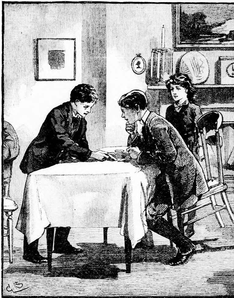
ITT AZ IRÁS. (Lásd a 409. lapon)

hirtelen vállon ragadta valaki és egy ismerős, borzasztó hang ráfördedt: