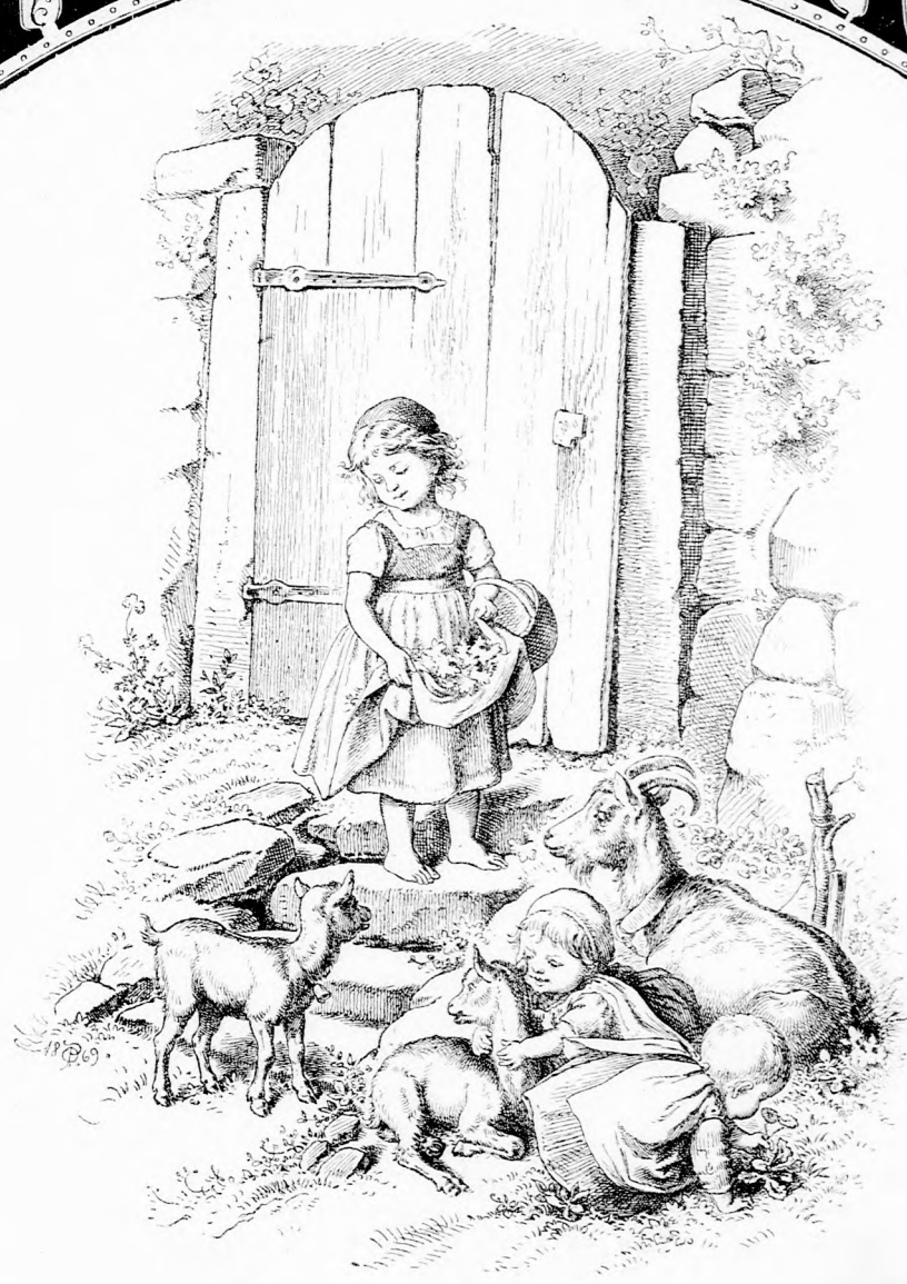
JÁTSZÓTÁRSÁK. (Lásd a 127. lapon.)