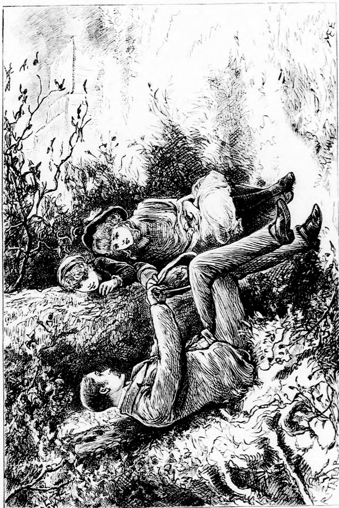
...A NAGY FA ALÁ. (Lásd a 116. lapot.)

nem úgy van és te sem szereted eleinte. Tudja, kérem, Dini és én összeesküdtünk és egy pár napig szépen össze is tar-