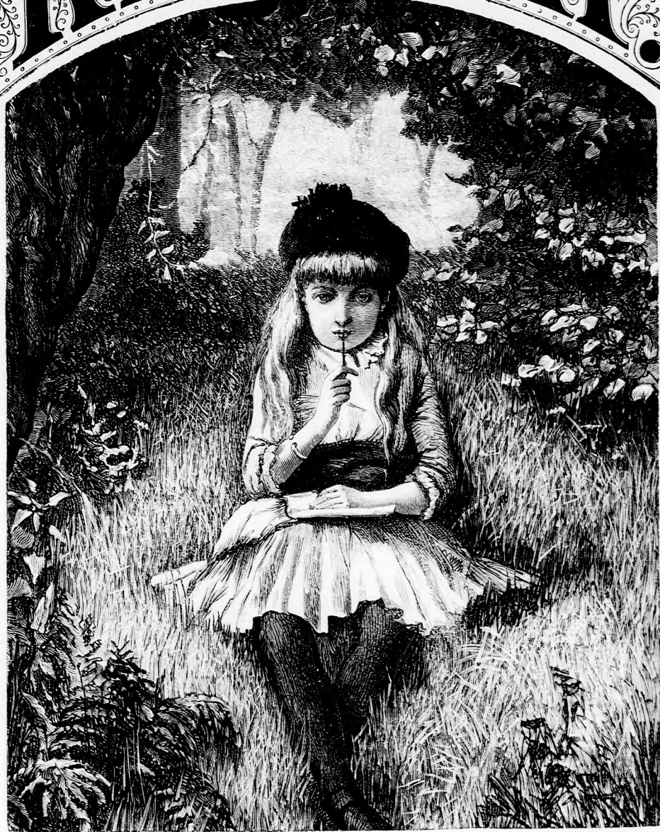
A KEDVENCZ HELYEN. (Lásd a 160. lapon.)