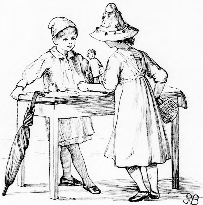
ALKU. (Lásd a 234. lapon.)

De csakhamar megjelent az inas, ki esernyőket hozott s a gyermekek baj nélkül jutottak haza. A zápor megeredt, a szél nem volt valami erős, de hajh! nagy jégdarabok is hullottak. A gyermekek azonban mégsem vették valami sokra az egész