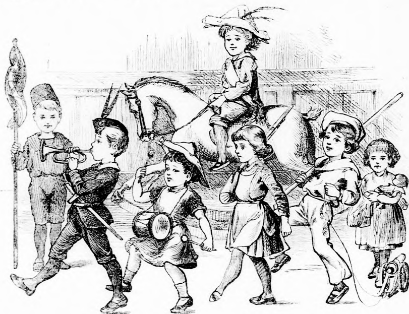
GYŐZELMES HADSEREG. (Lásd a 252. lapon.)