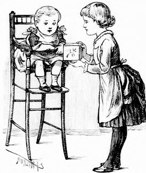
A BÜVÖS KATULYA. (Lásd a 269. lapon.)

tanítói nem győzték dicsérni haladását. Pár év mulva annyira jutott, hogy magánál idősebb fiukkal került egy osztályba. Es mikor először lépett be ebbe az osztályba, egy fiut látott, ki épen a szomszédja volt a padban s a ki nagyon ismerősnek látszott. Nagyon hányaveti, gögös viseletü urfi volt, de sok pajtás vette mindig körül. Mihamar megtudta Pali, hogy csak