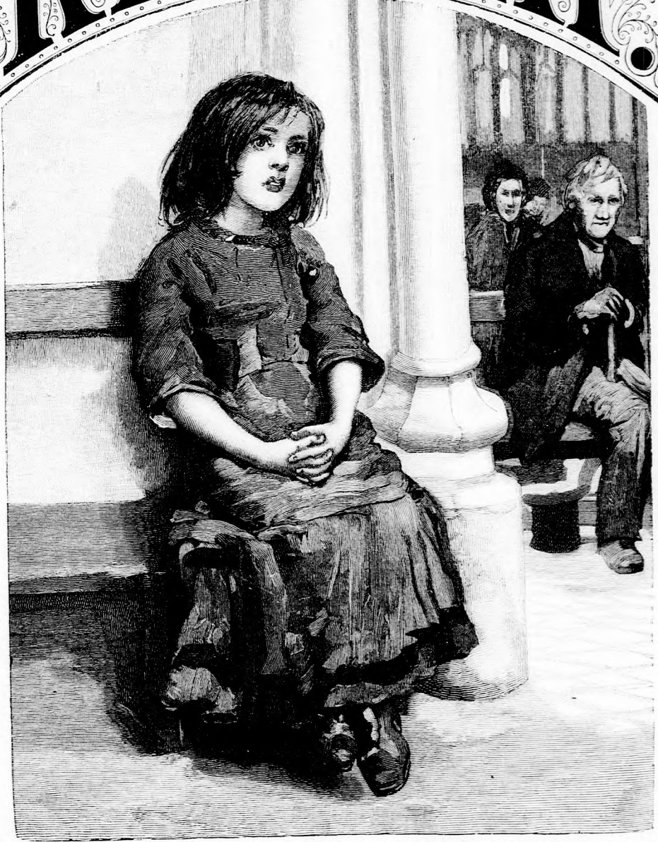
...HALLGATTA NAGY ÁHITATTAL... (Lásd a 267. lapon.)