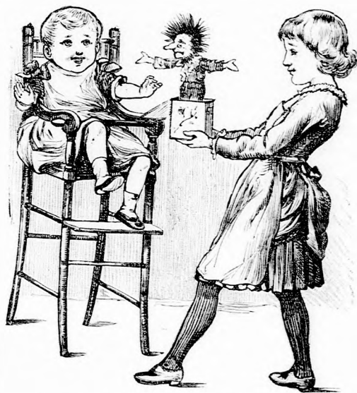
A BÜVÖS KATULYA. (Lásd a 269. lapon.)

— No bizony, gazdag vagyok, kell is nekem az a sok ostoba tudomány. Vigan fogok élni, az az unalmas tanulás csak az afféle sánta szomszédnak való. Hadd kínlódják az istenadta, a mig én mulatok.