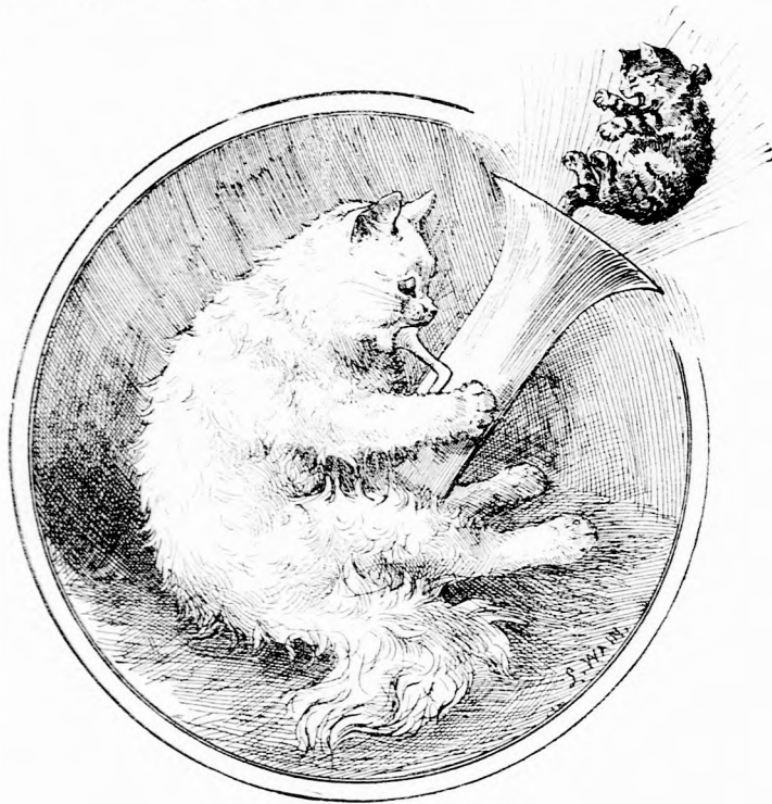
...SZERENCSESEN KI IS FUJTA. (Lásd a 330. lapon.)

Tömzsike megijedt, hogy baja lesz a madárnak és utána szaladt az ajtó mögé, éppen mikor Kata asszony közelebb ért.