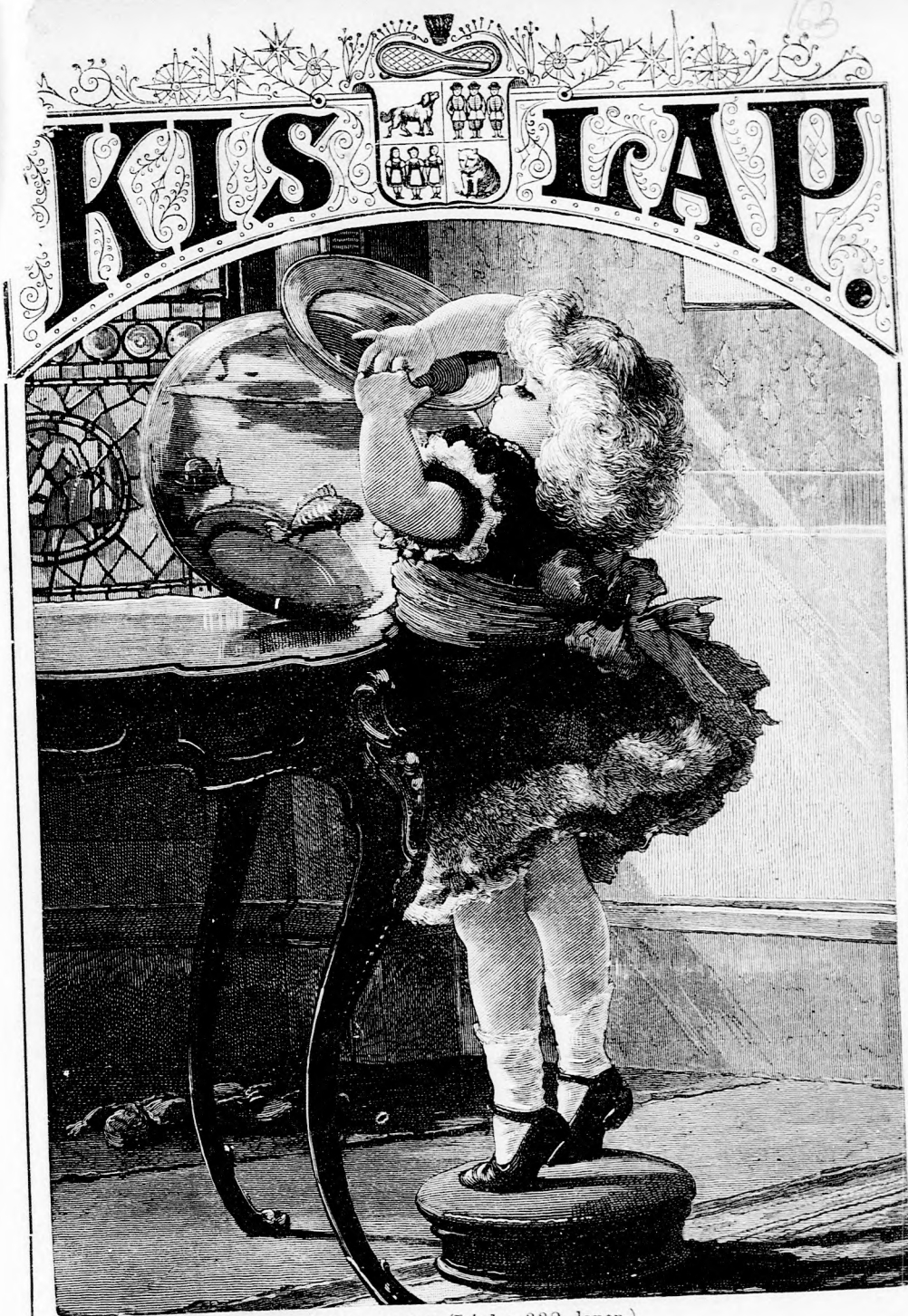
ARANY HALAK (Lásd a 332. lapon.)