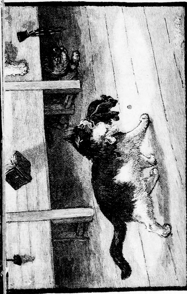
...JÓ VOLNA AZT ELVENNI. (Lásd a 331. lapon.)

otthon, berontott hozzánk ez a gonosz Tipi és mit csinált? — bedugta Bibit a trombitába! Mikor hazatértünk, nem ta-