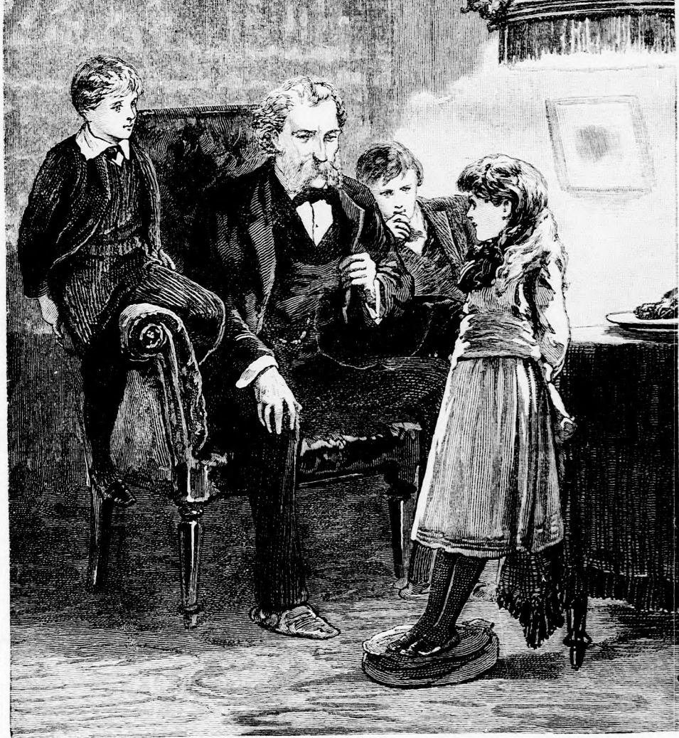
NAGY TANÁCSKOZÁS. (Lásd a 390. lapon.)