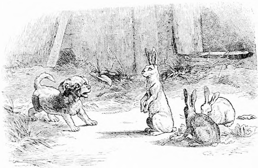
VÁRATLAN LÁTOGATÁS. (Lásd a 395. lapon.)

Jó kedve elmúlt, mérges volt magára a libákra és Boriskára. Miért jött éppen arra, mikor evett? Másképp ott marasztalta volna és játszhatnának, legalább nem telnék oly unalmasan az idő. Aztán segítene nekik a libákat őrizni, mert egymaga nem bír velök. Mióta Boriska elment,