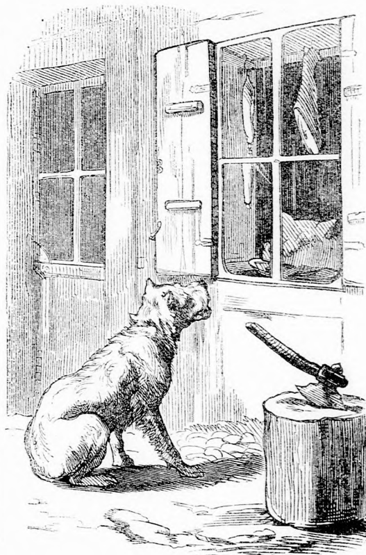
HENTES BOLTJA. (Lásd a 397. lapon.)

kem elmondta hol lakik, ki és mi az apja, erről pedig egy levéllel könnyű meggyőződni; azt ő is tudja, tehát nem mondhat valótlanságot. Én különben is mindent hiszek, amit ő mond.