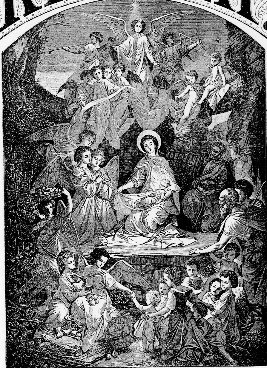
A KIS JEZUS SZÜLETÉSE. (Lásd a 407. lapon.)