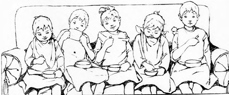
ÖT KICSI LEÁNY. (Lásd a 414. lapon.)

— Nem, kedves fiam, szólt anyja az örömtől könyezve. Oh, bizony bűnös voltam, hogy zugolódtam a Gondviselés ellen, pedig az vezette lépteidet és általad e szent estén megküldte a segítséget szegény hajlékunkba. Aldott legyen a szeretet napja!