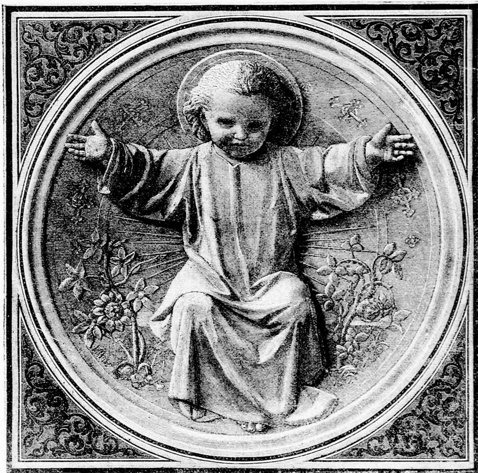
ÁLDÓ JÉZUSKA. (Lásd a 413. lapon.)

azon töröm most a fejemet. Nagyon furcsa egy história ez.