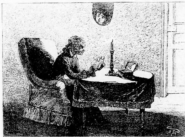
...SOKÁIG BÁMULT A PÁPASZEMRE. (Lásd az 53. lapon.)

Jól hallottam. »Jőjj kedves pápaszem, segíts!« Ezt mondta. Hogyan segíthet valamin a pápaszem? Hogy jobban lát rajta, azt tudtam; de hát azért nem kell külön segítséget kérni tőle. Valami különösnek kell abban a pápaszemben lenni. Én már régóta gyanakodtam rá. Ma a nagymama igen komoly és szomorú volt, sok