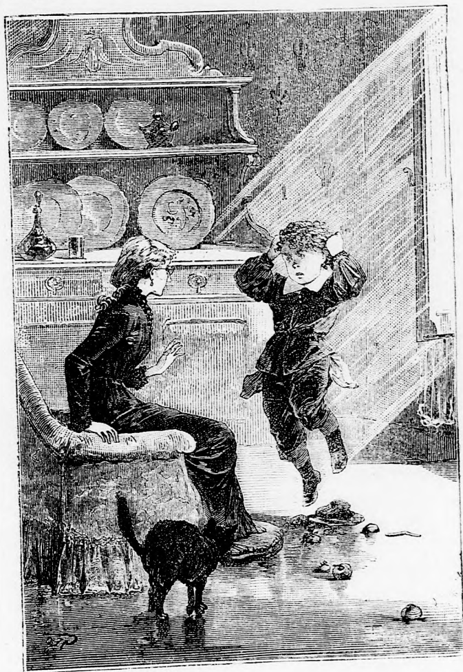
... ÚGRÁLTAM ÉS TOPORZEKOLTAM. (Lásd az 55. lapon.)

kik valami titkos varázserő. Így aztán nem csoda, ha mindjárt mindent tud. Harmadnapra még inkább meggyőződtem sejtelmem alaposágáról, mert eszembe jutott,